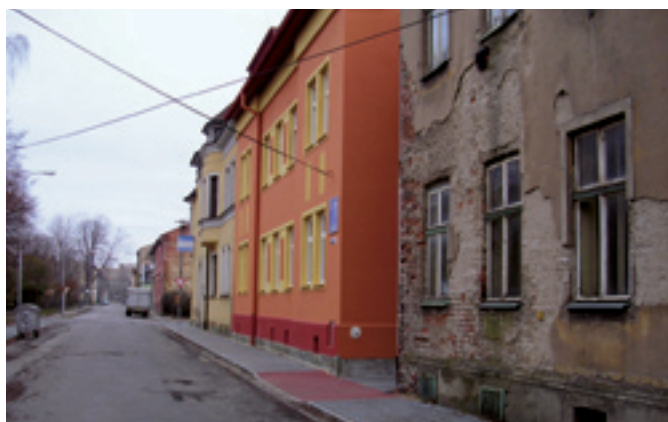
Ul. Kutuzovova, rekonstrukce chodníku Dodavatel: MOB Vítkovice, vlastními pracovníky