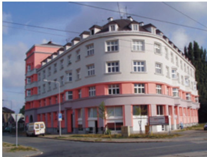
Štramberská 2 - 4 - ukázka zateplení uliční fasády. Dodavatel VAMOZ servis a. s., Ostrava - Vítkovice