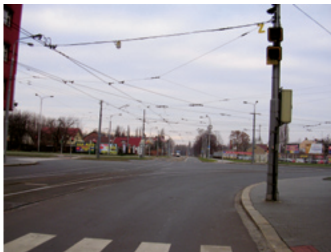
Ruská x Závodní, rekonstrukce křižovatky včetně kamerového systému a chodníků. Dodavatel: STAVIA - silniční stavby, a. s.