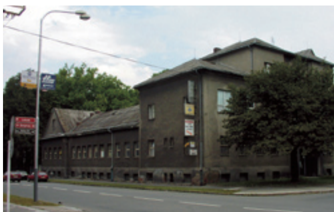
Zengrova 14 - původní stav domu