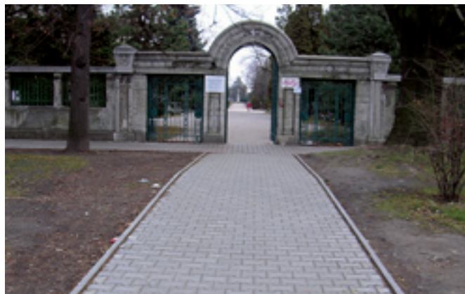
Hřbitov, ul. Závodní 78, úprava vstupu a přilehlých chodníků. Dodavatel: MOB Vítkovice, vlastními pracovníky