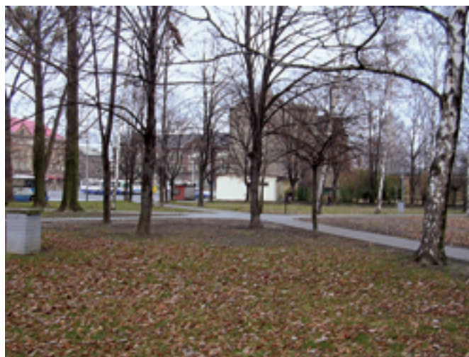
Náměstí Jiřího z Poděbrad, rekonstrukce chodníků. Dodavatel: MOB Vítkovice, vlastními pracovníky