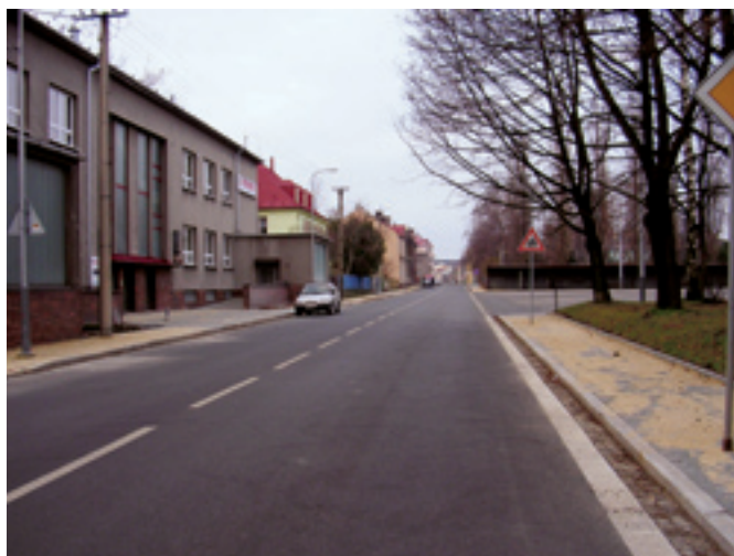
Ul. Erbenova, rekonstrukce komunikace a chodníků. Dodavatel: STAVIA - silniční stavby, a. s.