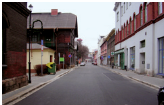
Ul. Mírová, úsek Jeremenkova až Výstavní, oprava komunikace a chodníků. Dodavatel: STAVIA - silniční stavby, a. s.