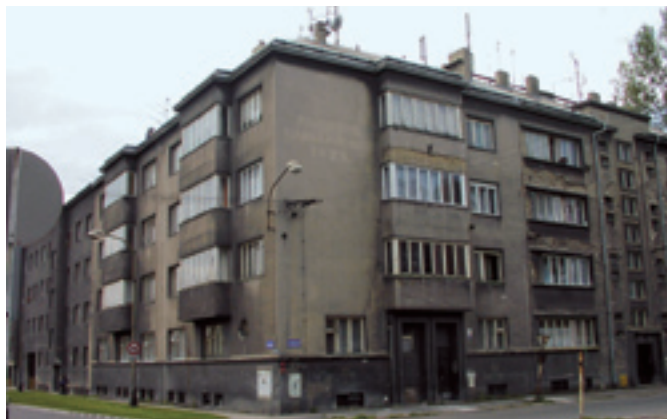
U cementárny 29 - ukázka původního stavu