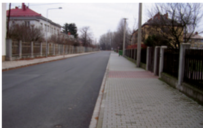
Ul. Sylařova, oprava povrchu komunikace. Dodavatel: Jankostav s. r. o.