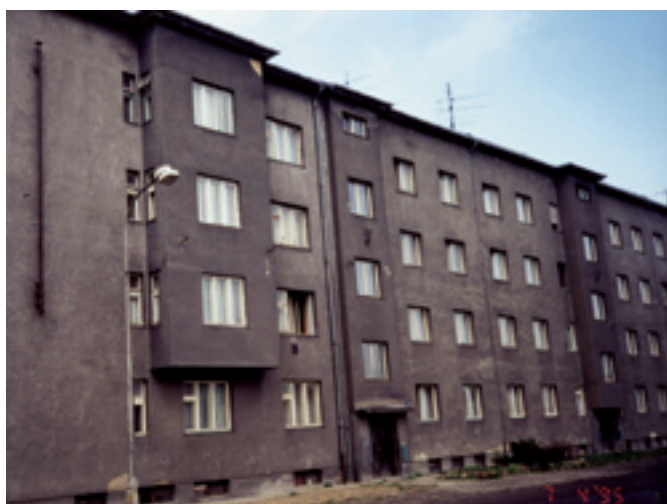
Sylabova 25 - 27 - ukázka původního stavu