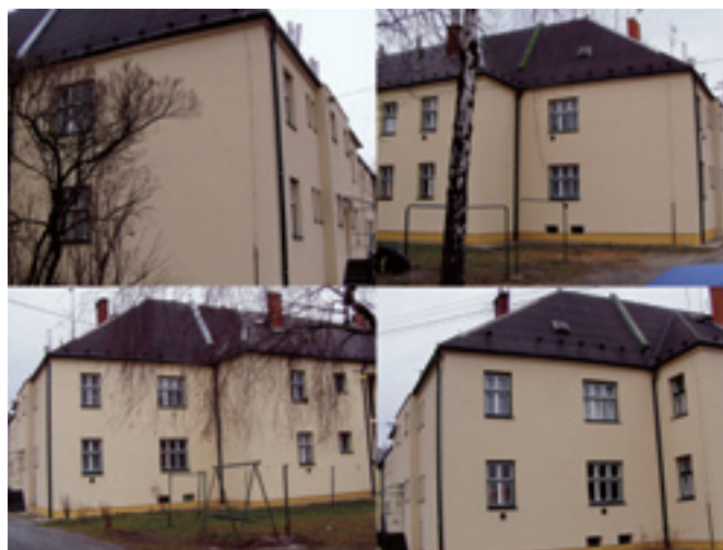
Rudná 44 - 64 - ukázka části zateplených fasád. Dodavatel EKOFAS s. r. o., Ostrava - Vítkovice