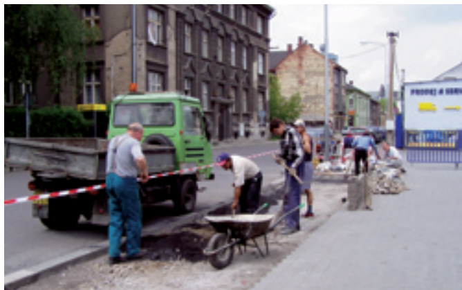
Ul. Tavičská, rekonstrukce chodníků Dodavatel: MOB Vítkovice, vlastními pracovníky