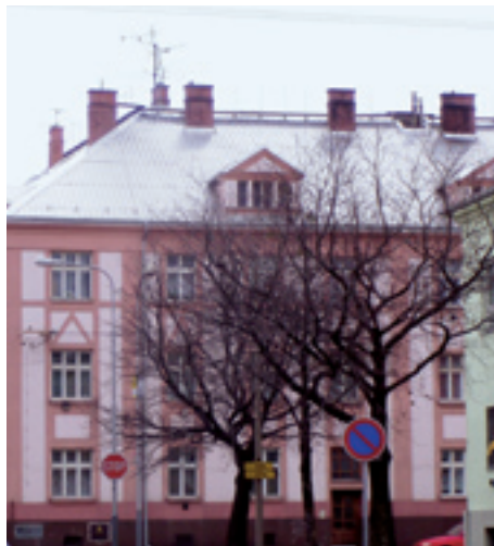
Lidická 31 Dodavatel: Ctibor Varga - DIANA, O.- Poruba