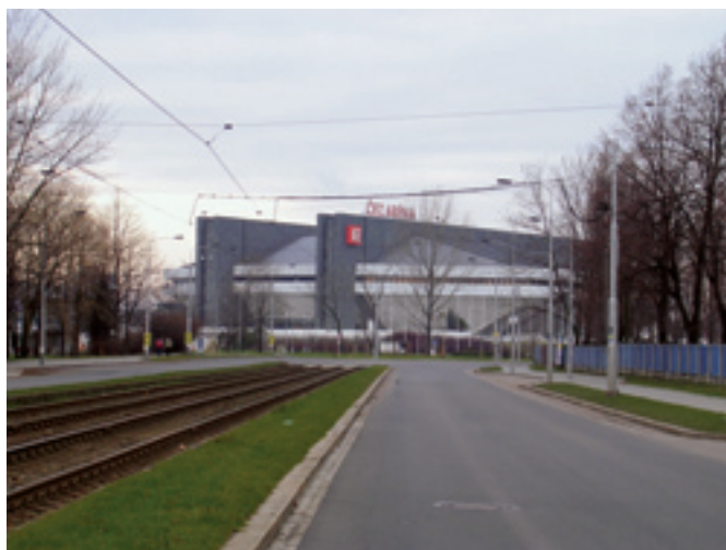
Ulice Závodní, rekonstrukce komunikace a chodníků před MS v hokeji. Dodavatel: ODS - Dopravní stavby Ostrava, a. s.