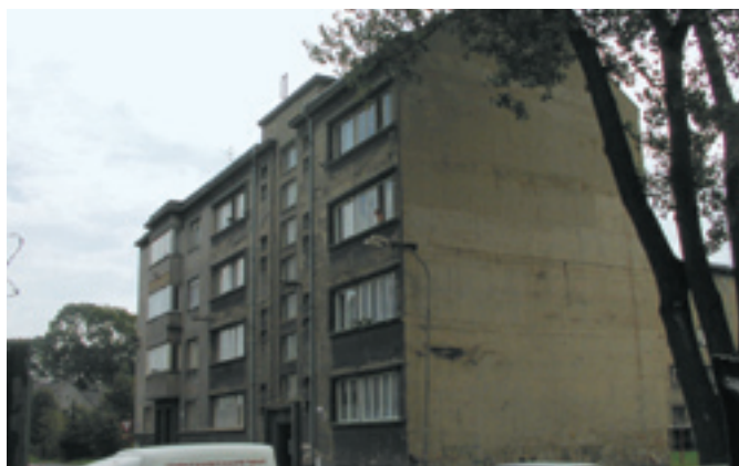
U cementárny 31 - původní stav vnějších omítek