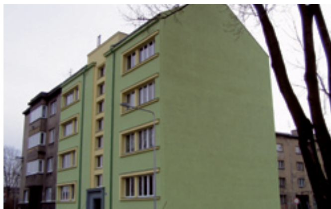
U cementárny 31 - výměna oken a zateplení fasády. Dodavatel ESA building s. r. o., Ostrava - Mariánské Hory