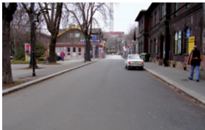
Ul. Věžní, oprava povrchu komunikace a chodníků. Dodavatel: STAVIA - silniční stavby, a. s.