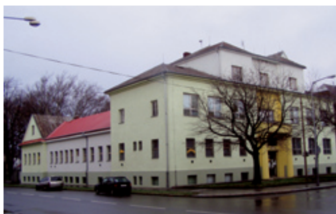
Zengrova 14 - oprava a nátěr vnější fasády. Dodavatel Petr Raška, Ostrava - Jih.