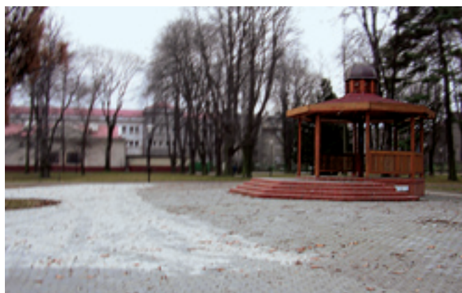
Sad Jožky Jabůrkové, rekonstrukce chodníků. Dodavatel: STAVIA - silniční stavby, a. s., SATES MORAVA spol. s r. o.