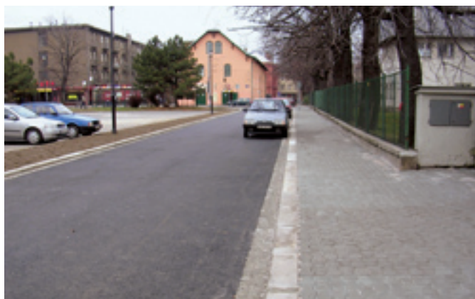
Ul. Zálužanského, oprava povrchu komunikace a chodníků. Dodavatel: STAVIA - silniční stavby, a. s.