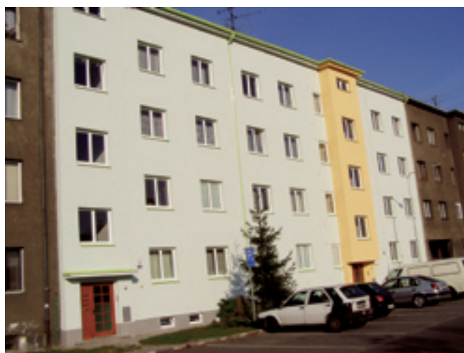
Sylabova 25 - 27 - výměna oken a oprava fasády. Dodavatel VAMOZ servis a. s., Ostrava - Vítkovice