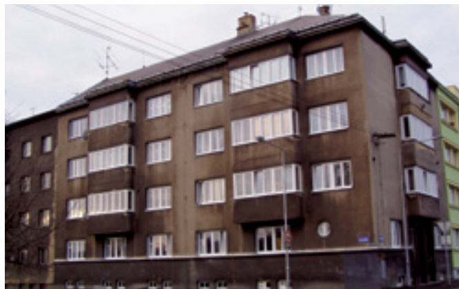
U cementárny 29 - ukázka výměna oken a zateplení půdy. Dodavatel VJAČKA s. r. o., Ostrava - Mariánské Hory