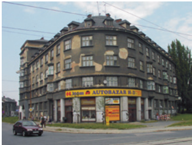
Štramberská 2 - 4 - ukázka původního stavu