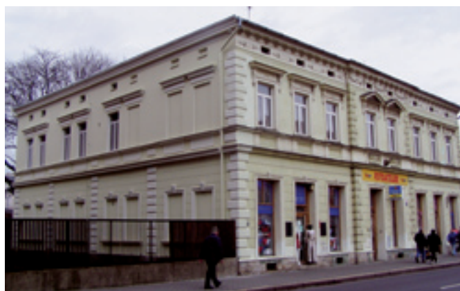
Jeremenkova 13 - oprava části vnější fasády. Dodavatel FALS s. r. o., Moravská Ostrava