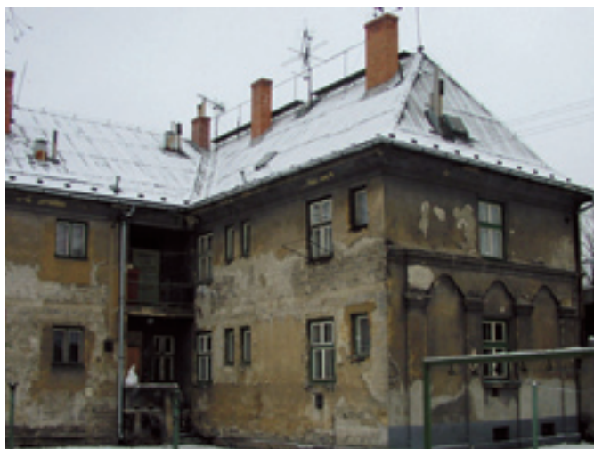
Rudná 44 - 64 - ukázka původního stavu