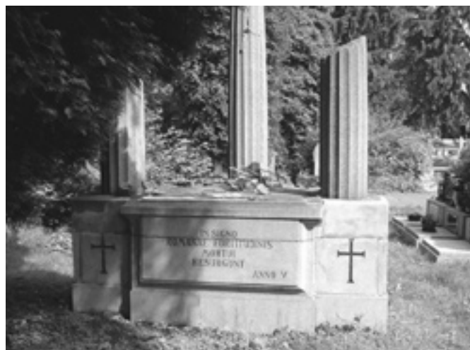
Pomník italských vojáků