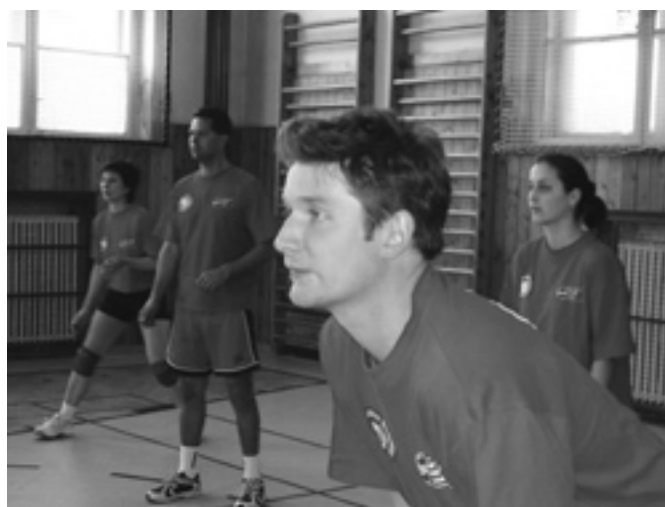
Hráči ZŠ Rostislavova

Všem zúčastněným blahopřejeme a těšíme se na podzimní setkání! /ib/