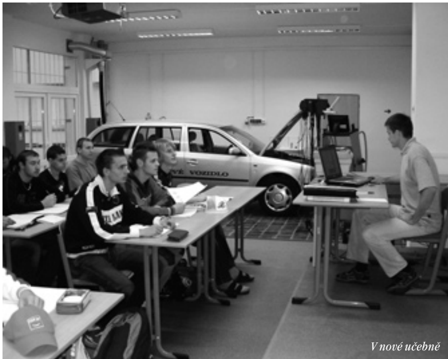
V nové učebně