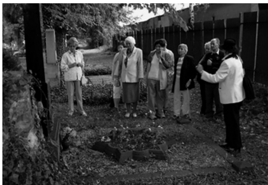
Zůstali v Osvětími...