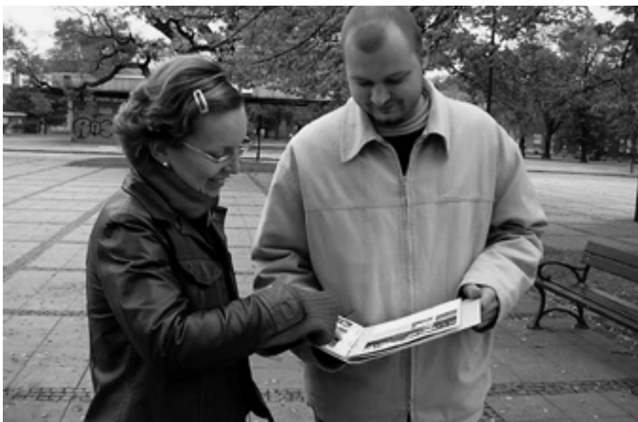
Seznámení s projektem Ostravská zákoutí

Z Antikváriátu Fiducia nás na Karolinu přes Vítkovice, kolem vysokých pecí, dovezl historický autobus RTO s vlečkou. Vyvolával obrovský rozruch mezi lidmi na chodnících. I někteří jeho pasažéři v něm seděli poprvé. Pod klenbou dvojhalí působily velkoplášné fotografie zvláště emotivně (téměř jako v muzeu Orsay v Paříži, kde jsou vystaveni impresionisté), reflektory v hale na ně promítaly siluety prohlížejících si návštěvníků a tak pro všímavé oko zde vznikaly zajímavé dvojprojekce. Důkazem zájmu