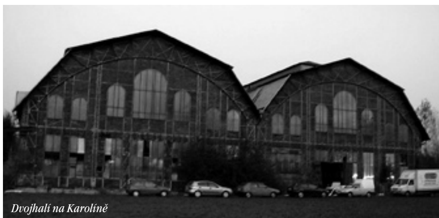
Dvojhalí na Karolině