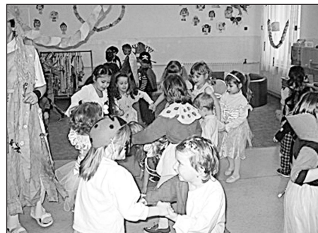
I. B. Děti v maskách byly ve svém živlu...