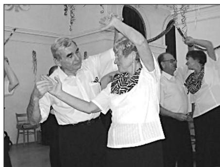
Seniorům to slušelo...