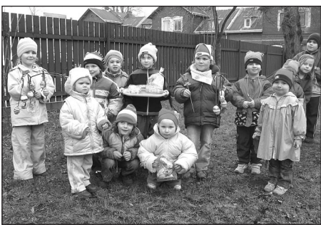
Kde je ten zajiček?