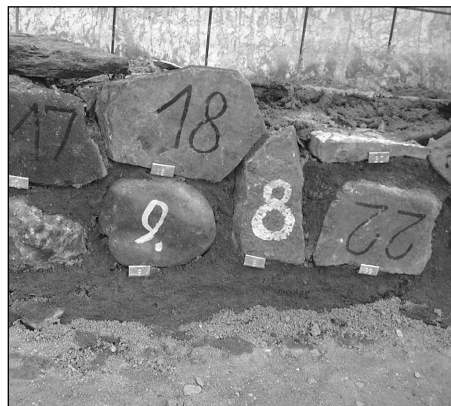
Kámen z Vítkovic má č. 9.