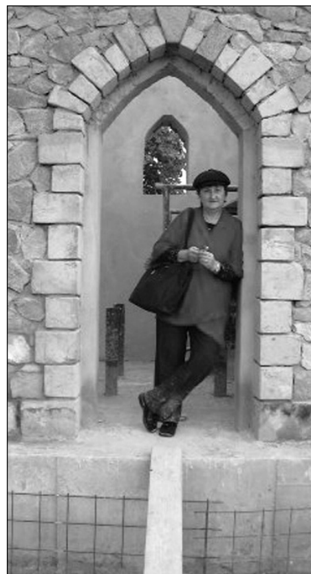
Autorka článku ve vstupu rozhledny.