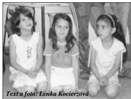
Text a foto: Lenka Kocierzová

V CENTROMU na Sirotečí ulici probíhal 1. června 2007 Den dětí pro romskou komunitu. Tři tanečnice vystoupily se svými kreacemi, zazpívaly se a potom už si děti zábavu užívaly samy. Prostory zde jsou velmi příjemné a kultivované.