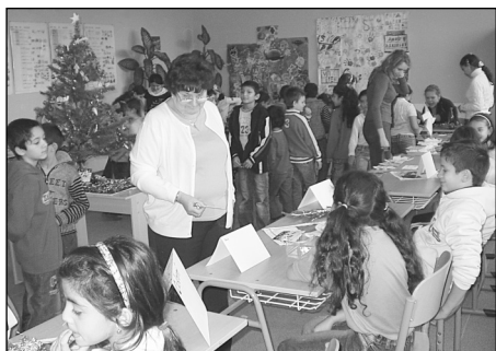
Vánoční jarmark ve škole