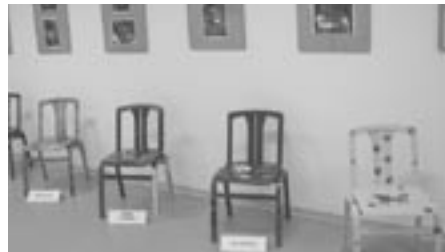
Namaluj si svou židli