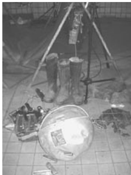
Dekorace industriální opery