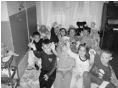
Ahooj, takhle vás zdraví děti z mateřské školy Prokopa Velikého.