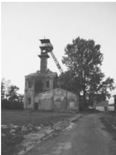
Věž Dolu Alexandr