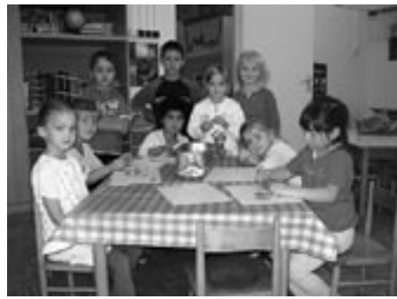
Na mateřské škole Kořenského vám hned něco dobrého uvarí ( bohužel jen z plastelíny)