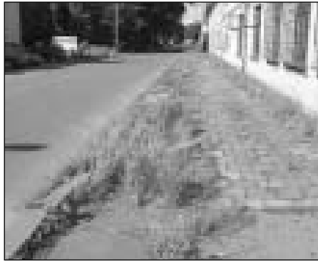
Mostárenská - stav před opravou komunikace

Na letošní rok měla společnost Ostravské komunikace naplánovanou rekonstrukci komunikace Mostárenská v celé její délce. Realizace stavby se uskutečnila v měsících květnu a červnu. Přilehlé chodníky, které vlastní MOB Vítkovice, byly v naprosto dezolátním a neschůdném stavu, proto bylo nutné zkoordinovat opravu vozovky s opravou chodníků. Odbor KSDaB tedy provedl veškerá nutná opatření k realizaci opravy chodníku.