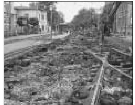
Ruská - stav komunikace k 23. 7. 2008