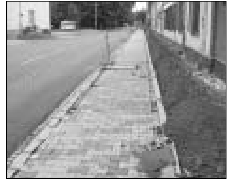
Mostárenská - stav komunikace před dokončením prací