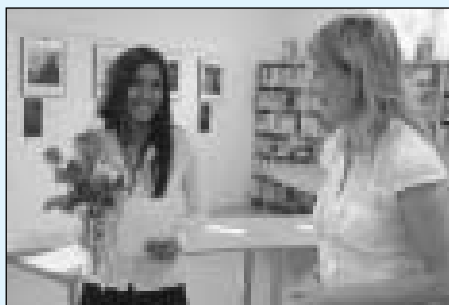
Možná bude jednou mezi vystavenými portréty.