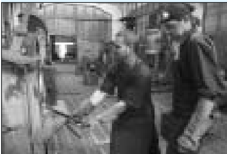
Snímky pocházejí z loňského ročníku symposia, který měl název Andělé mezi námi .