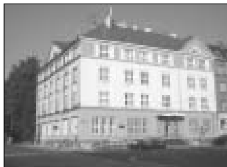
Od 1. 9. 2008 je po rekonstrukci vnitřních prostor opět v provozu pošta na nám. Jiřího z Poděbrad. I když opravy především z vnější strany objektu ještě pokračují, mohou občané jednotlivě nové zrekonstruované přepážky již plně využívat.