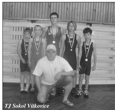
TJ Sokol Vítkovice