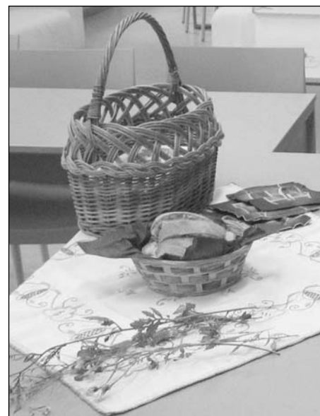
Texty a foto na straně: Lenka Kocierzová

uvařily čaj. Prohlédli jsme si výstavu fotografií Dity Pepe a potom si jen tak povídali, hledali jsme v atlasech květiny nasbírané cestou. Buchty, které jsem z košíčku prostřela na vyšívaný ubrus, prý byly velmi dobré... Tak co, přijdete příští rok?