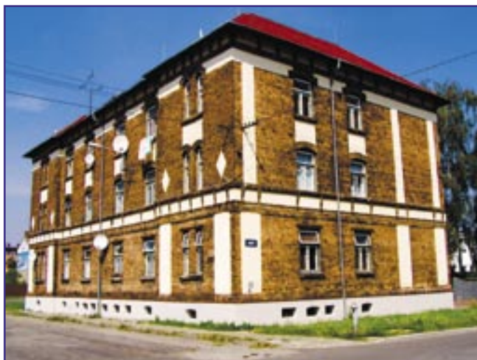
Oprava vodorovné a svislé izolace