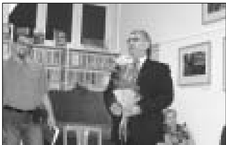
Foto z vernisáže výstavy Vítkovická ulice - rok dvatisíce z 25. 11. 2008.

Přijďte si prohlédnout působivou výstavu. Všechny srdečně zveme.