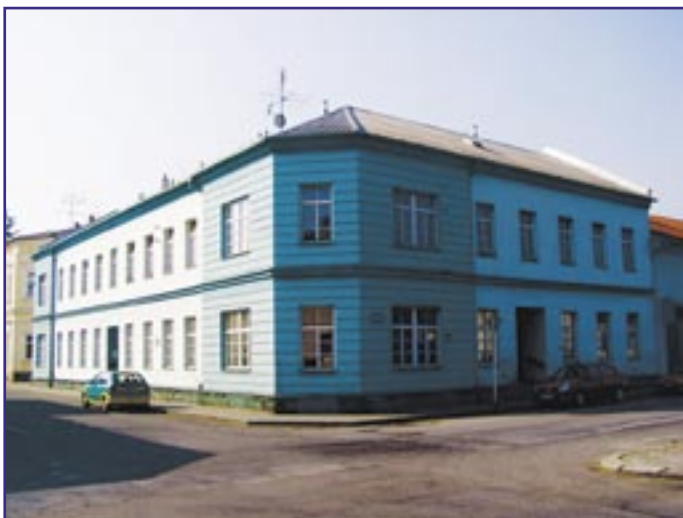
Zdravotní středisko pro praktického lékaře