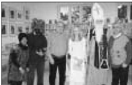
Do knihovny srdečně zvou

V pátek 5. 12. 2008 se za finanční podpory ÚMOB Vítkovice konala Mikulášská besídka. Děti se přesvědčily, že s čerty nejsou žerty.