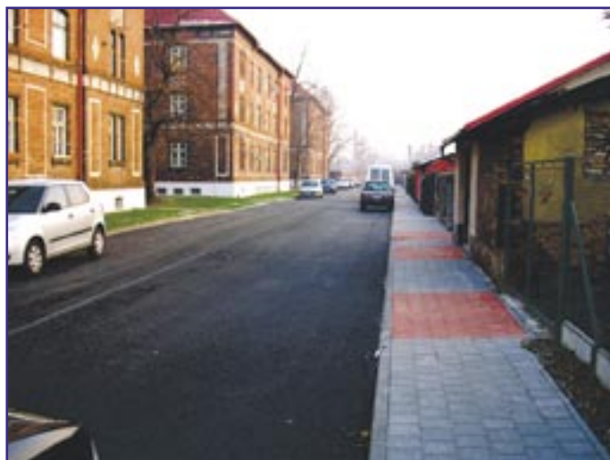
Oprava vozovky i chodníků