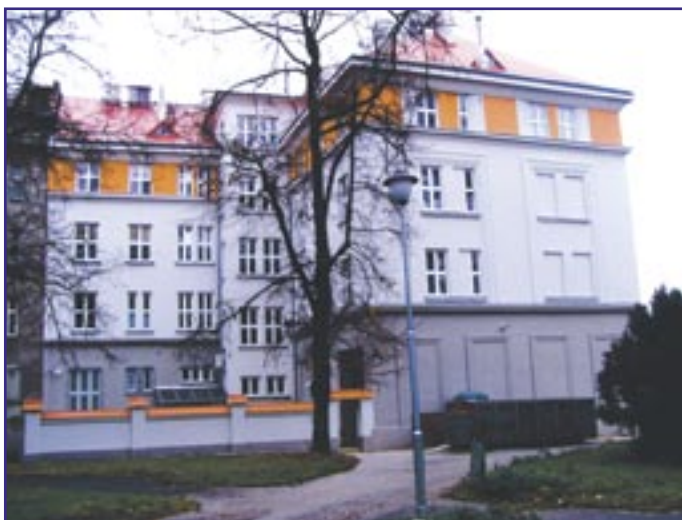
Stav po rekonstrukci - zadní strana