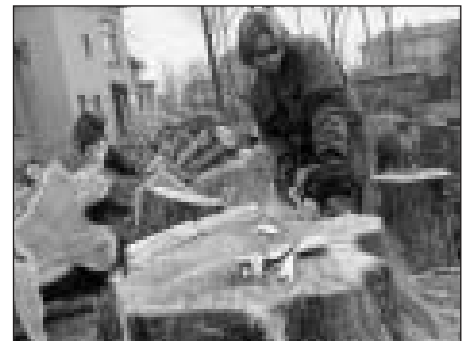
V prosinci byly káceny stromy také v ulici U Cemen-tárny.