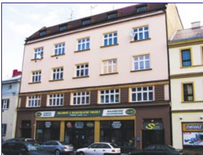
Výměna oken a oprava fasády