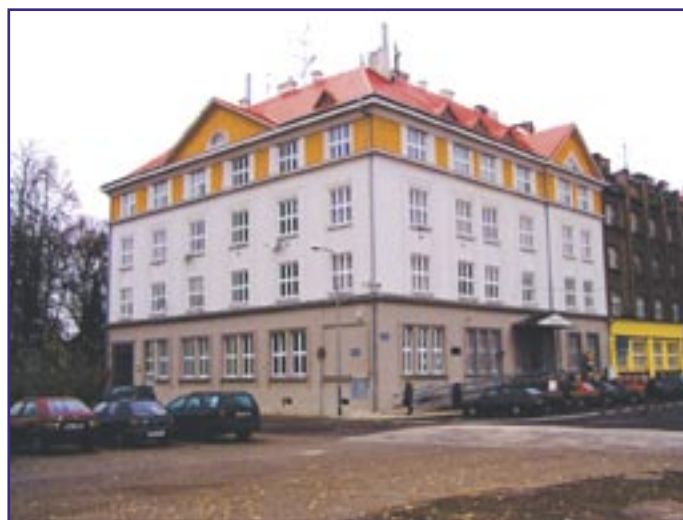
Stav po rekonstrukci – čelní strana