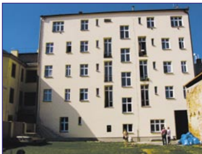
Výměna oken a oprava fasády – dvorní část