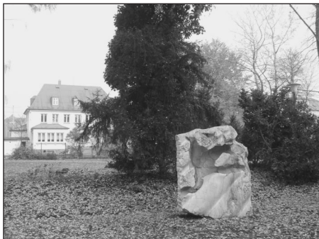
Text a foto: Lenka Gulašová

Souběžně s tím se připravuje renovace kamene u Bezručovy lípy a zvažuje se také oprava sousoší medvídat, které by pak v nové podobě mělo být v rámci parku přemístěno na vhodnější místo. Park Jožky Jabůrkové se prostě stává příjemným místem, které láká k procházkám, posezení, ale také sportování občany Vítkovic i návštěvníky obvodu.