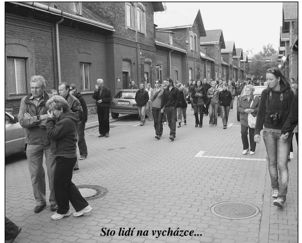
Sto lidí na vycházce...

25. října 2009 - se dvěma skupinami jsme za krásného slunečného nedělního odpoledne prošli základní vítkovickou trasu až k Českému domu. Přišli i rodiče s dětmi. Byla