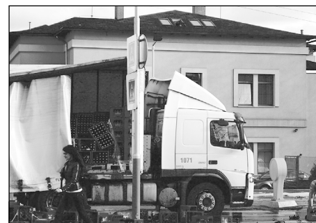
Kuriózní nehoda se stala dne 23. 11. 2009 na křižovatce Halasova a Výstavní. Z kamionu se vysypaly stovky lahví piva! Kronikářka byla při tom...