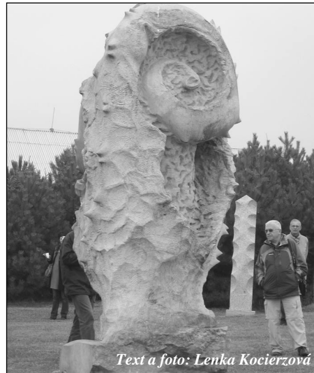
Text a foto: Lenka Kocierzová

Další sochy z několika ročníků jsme pak viděli v dětském koutku ve Stonavě, v Havířově, na hřbitově ve Svinově, v parku Milady Horákové, v Petřkovicích na náměstí a mnoho dalších v Hornickém muzeu na Landeku. Doporučuji výlet do Horního Dvora i do Hornického muzea OKD.