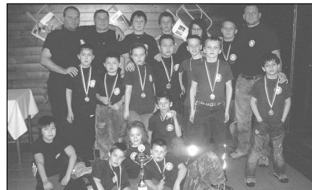
Naše společná výprava po večeri v restauraci Na Spilce.