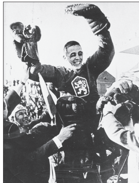
Okamžik slávy a radosti po posledním zápase na MS 1961 po vítězném zápase se Švédskem.

„Jakmile jsem se naučil číst, četl jsem sportovní stránky novin. A ty jsem pak louskal i ve škole pod lavicí. Takže ke sportu a novinám jsem měl vztah opravdu od dětství,“ prohlašuje