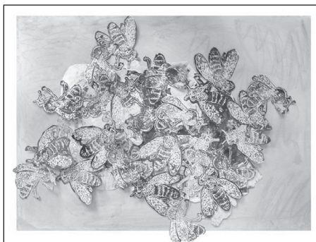
Cena starosty 2010, Sylvie Čonková, ZŠ Šalounova, 7. tř.