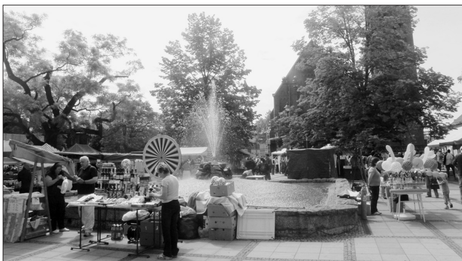
Nechyběly atrakce, stánky, ani ukázky lidových řemesel.