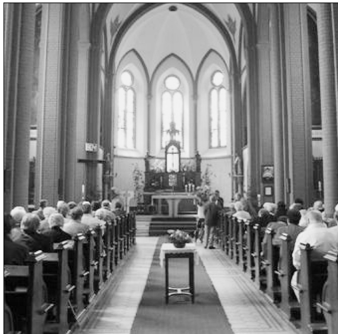
Dopolední mše v kostele sv. Pavla