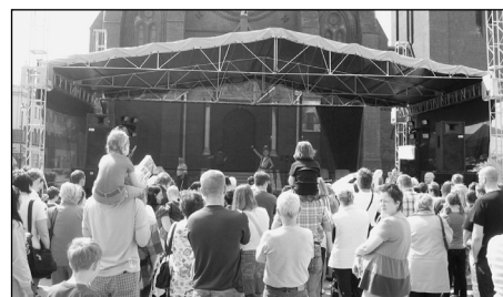
Na pódiu se vystřídali jednotlivci, soubory, malí i starší umělci