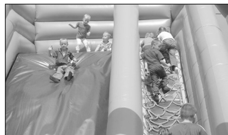
Nahoru a dolů