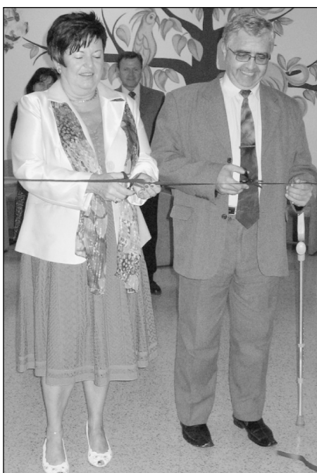
Otevření Vítkovických zastavení II.