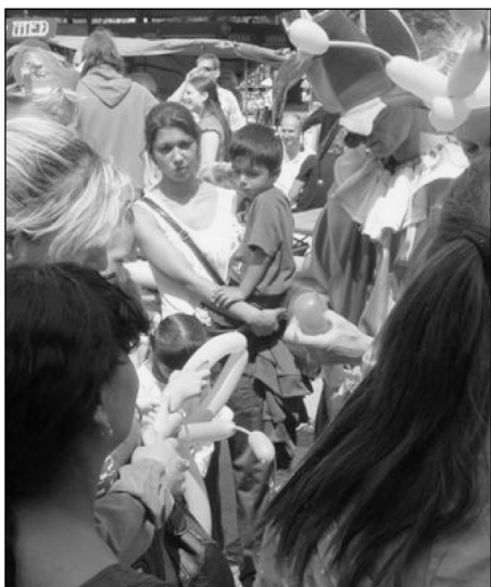
Nechyběli ani klauni