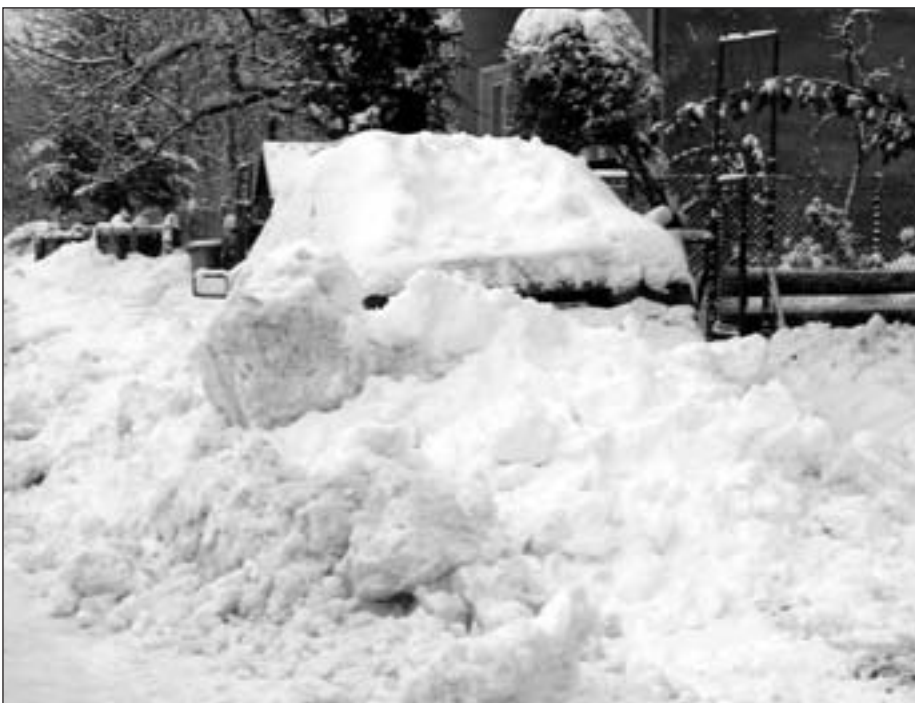
Více o sněhové nadílce v našem obvodu na str. 8.