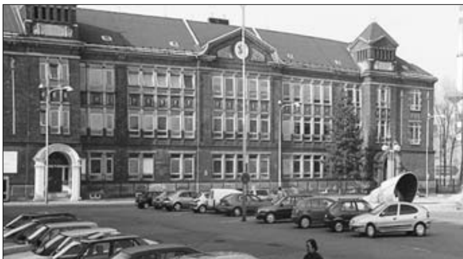
Ahol Střední odborná škola na Halasově ulici

Redakční rada si vyhrazuje právo krácení textů.