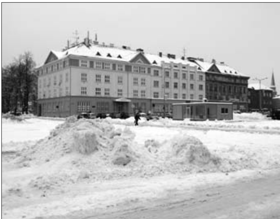
Náměstí Jiřího z Poděbrad.