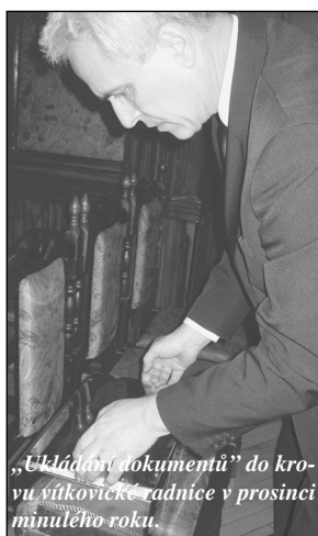
„Ukládání dokumentů“ do krovu vítkovické radnice v prosinci minulého roku.