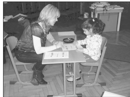
Z letošního zápisu prvňáčku na radnici.

Jakékoliv další informace k nově otevřené 1. třídě a k možnosti zápisu do této třídy poskytneme na tel. číslech 596 614 251, 596 614 245, 736 764 041 nebo přímo na ředitelství ZŠ Šalounova 56 v Ostravě-Vítkovicích.