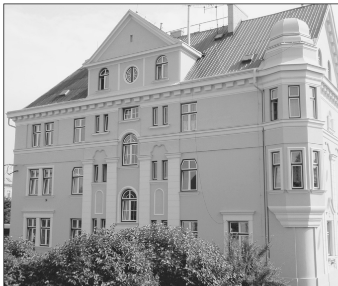
Po opravě fasády.