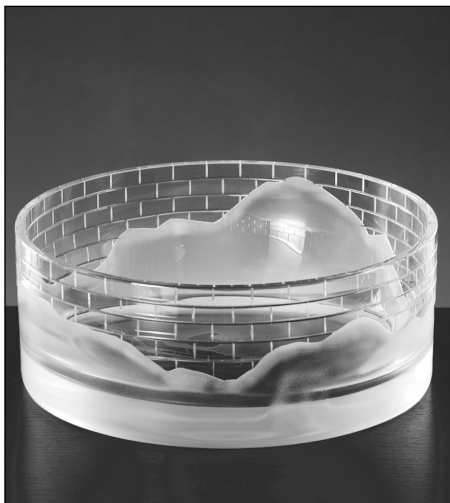
Misa brus pískovaný křišťál.

Třicítka svých výstav by měla završit v listopadu v Domově mládeže na Lidické ulici. Miluje industriální architekturu a památky a první „výrobek“ s industriální tematikou (cihly a struska) byl realizován ve sklárně MOSER Karlovy Vary, která s ní spolupracuje.