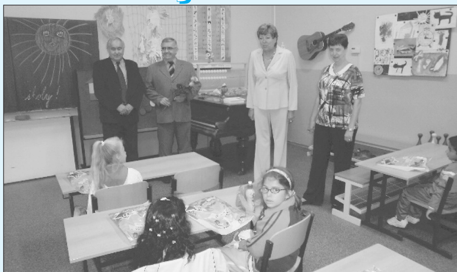
1. třída v ZŠ Šalounova 56.