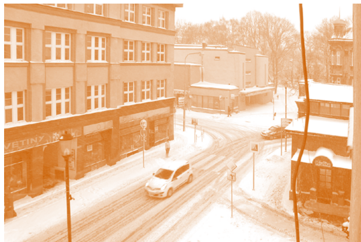
Malý hrdina už odešel...

Jednání proběhlo 8. února, na programu byly tři body. Bod 1 vzali zastupitelé na vědomí s tím, že po kontrole prováděné pracovníky MMO bude tento bod zařazen do programu řádného jednání zastupitelstva. V bodě 2 zastupitelé rozhodli, že Rada MOB Vítkovice nebude rekonstruována. V bodě 3, různé, proběhla diskuse mezi zastupiteli, do které se zapojili i přítomní občané Vítkovic. -red-