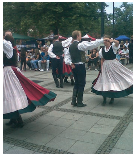
Lidové písně a tance rozeznaly Mírové náměstí a moc krásně připomněly půvab dávno zašlých časů i potřebu chránit odkaz našich předků.