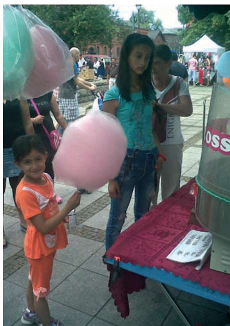
Cukrová vata. Poufová vášeň několika generací, nadýchaný růžový sen, o němž se vám může ještě dlouho zdát...