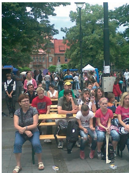
Na podiu před kostelem svatého Pavla se tančilo a zpívalo a lidé zaujatí programem seděli a koukali a občas si skočili pro něco dobrého nebo s dětmi ke kolotoči.