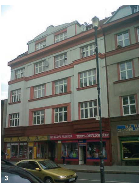
Z rozpočtu obce byly opraveny domy Rudná 40 (1), Jeremenkova 8 (2) a Jeremenkova 19 (3).