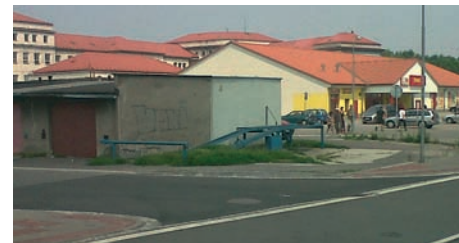
U PENNY marketu jsme propojili ulici Bivojovu s Chodskou.