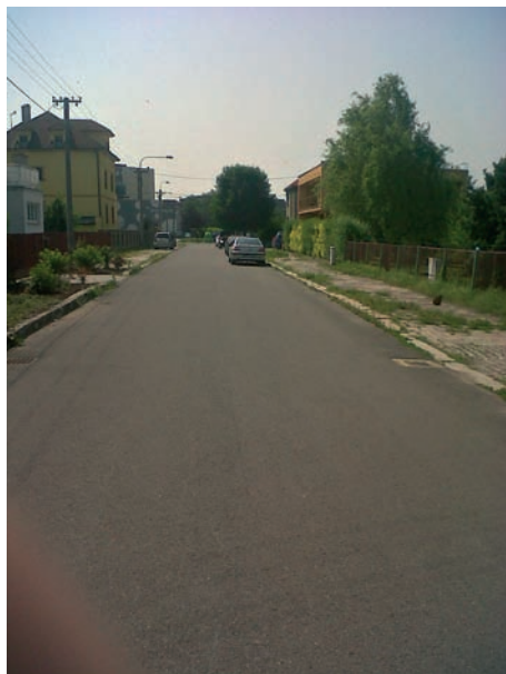
Obnovili jsme část Holubovy ulice.