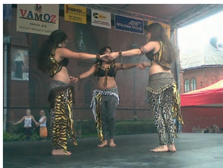
Zosobněný temperament v podání kroužku orientálního tance ze Základní školy Šalounova.

Plocha Mírového náměstí byla 23. června zastavěna stánky, točily se tu kolotoče, kolo štěstí i sukně tanečnic, voněly tu dobroty a hrála hudba, pestrobarevné balonky se vznášely nad hlavami spokojených mrňousků, program běžel jako podle partesu a počasí ukázněně přálo všemu tomu hemžení na Petropavlovské pouti.