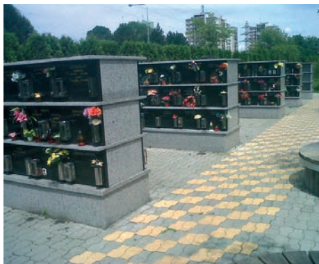
Rozšířili jsme kolumbárium na vítkovickém hřbitově.