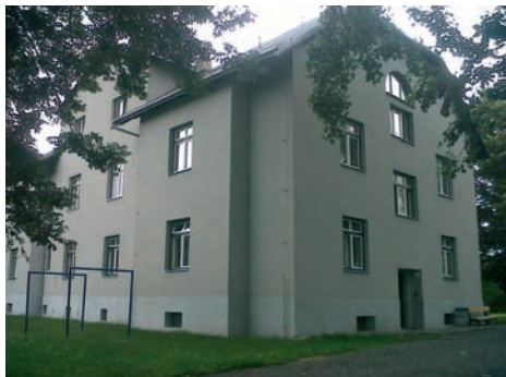
Program IPRM umožnil také rekonstrukci Siroťákův dům 39A.