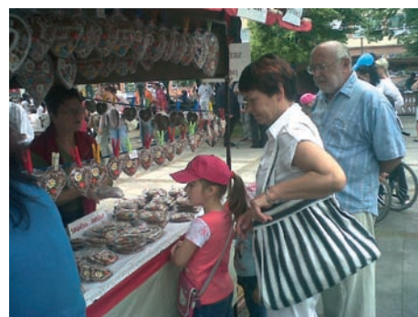
K pouti patří perníkové srdce už od nepaměti. Z lásky, z radosti, pro hezkou vzpomínku, mamince, babičce, Marušce či Honzíkoví...