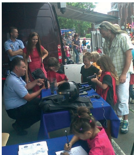
Policisté v uniformách představili svou práci tak zábavnou formou, že kolem jejich stánku bylo neustále plno.