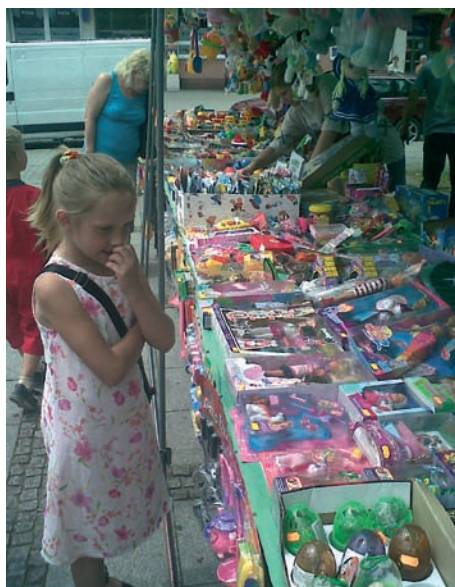
Největší radost z pouti mají vždy děti. I když dobře a promyšleně vybrat hračku, dá, milí dospělí, děsně zabrat!