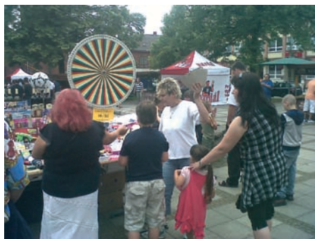
Přijďte blíž a roztočte si své kolo štěstí!