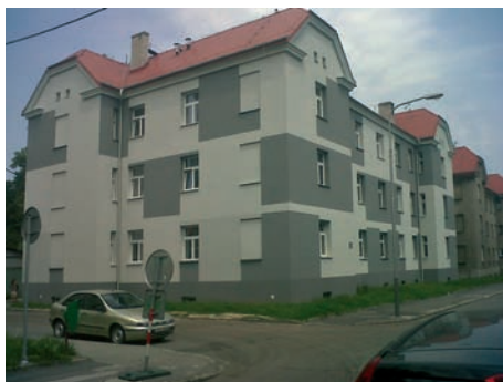
Finance programu IPRM změnily i tvář domu v ulici Zengrově 12.