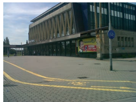
Po nové cyklostezce můžete od roku 2011 projíždět kolem vítkovického vlakového nádraží.