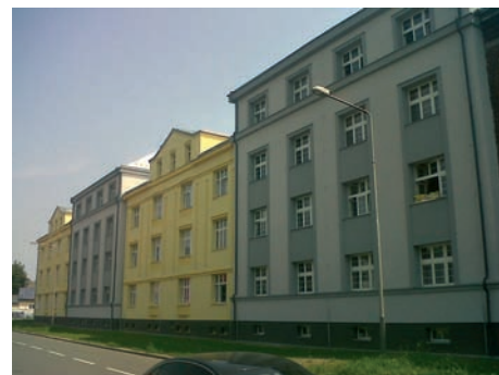
Elegantní kombinace šedé a žluté pokračuje v ulici Štramberské domy č. 12, 14, 16 a 18. Rekonstrukce ve Štramberské proběhly v rámci programu IPRM.