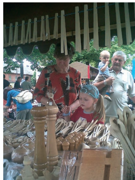
Stánky s tradičními řemesly už k vítkovické pouti patří neodmyslitelně. I letos bylo z čeho vybírat.