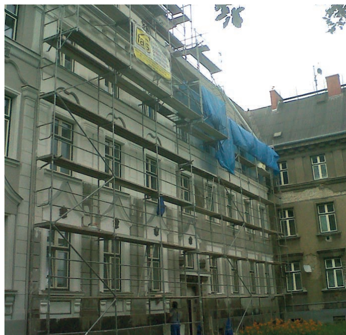
Běží oprava fasády domu Rudná 38.

Foto a text na dvoustraně: Lenka Gulašiová