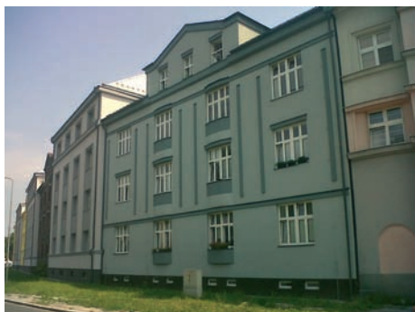
Štramberská se rozzářila hned při vjezdu z Ruské ulice nově opravenými domy č. 6 a 8.

Více komfortu, více barev, příjemnější bydlení i pohodlnější jízda opravenými ulicemi. To vše přináší rekonstrukce a investiční akce, které neustále mění tvář Vítkovic k lepšímu. Na této straně představujeme změny, k nimž došlo v roce 2011, a které přispívají k tomu, aby se nám ve Vítkovicích lépe žilo.