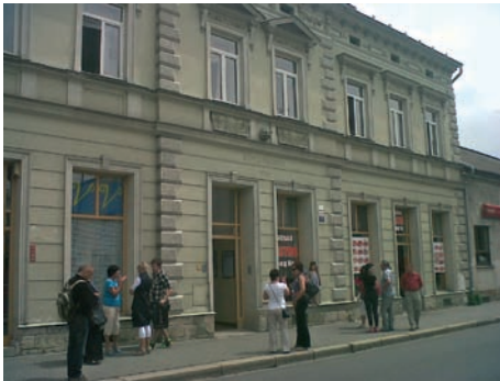
Půjdete-li kolem, zastavte se.

všichni společně stojíme na začátku prázdnin, které většinu z nás přináší také kýžený odpočinek v podobě dovolených. Přeji nám všem, ať toto období prožijeme smysluplně a ať si z letošního léta odnášíme jen veselé a příjemné vzpomínky. Věřím, že právě takové vzpomínky máte i na Petropavlovskou pouť, která 23. června rozezněla Mírové náměstí hudbou a smíchem a nabídla pořádný díl zábavy míst-