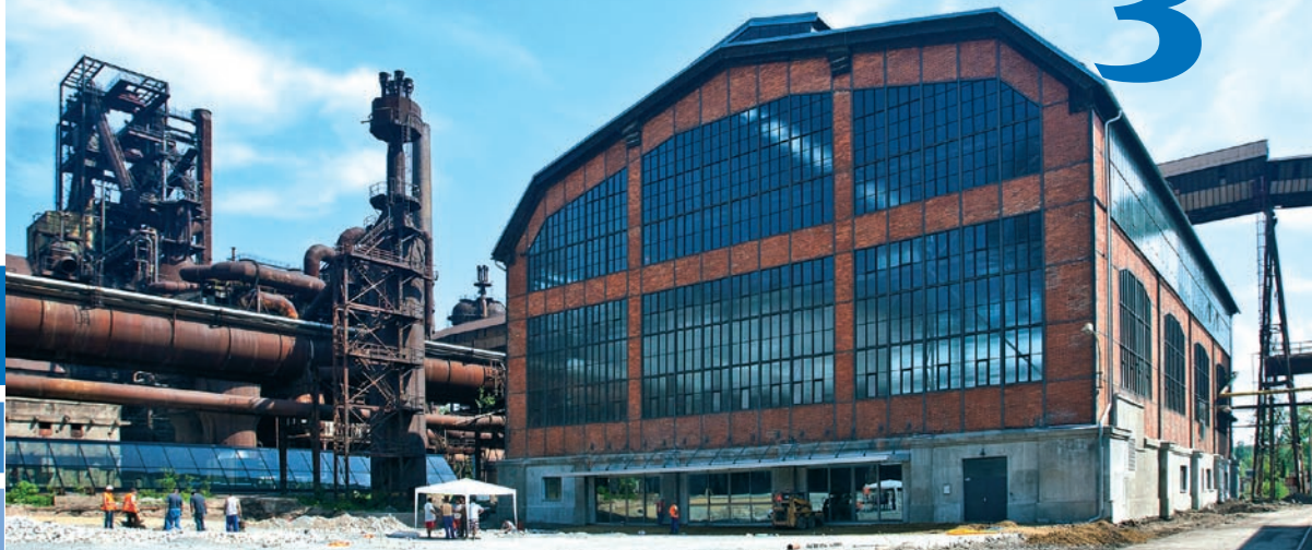
Historická budova U6 neboli VI. energetická ústředna v Dolní oblasti Vítkovic se stala centrem specializované výuky dětí, studentů i učitelů.

Nejlepší sportovci Vítkovic v roce 2012 str. 7