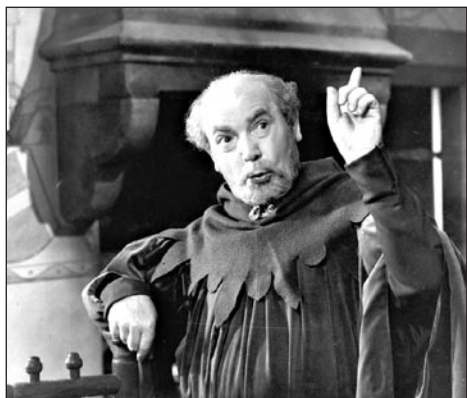
B. Smetana – Čertova stěna, Národní divadlo 1974.

Beno Blachut – operní pěvec *14. 6. 1913 Vítkovice †10. 1. 1985 Praha