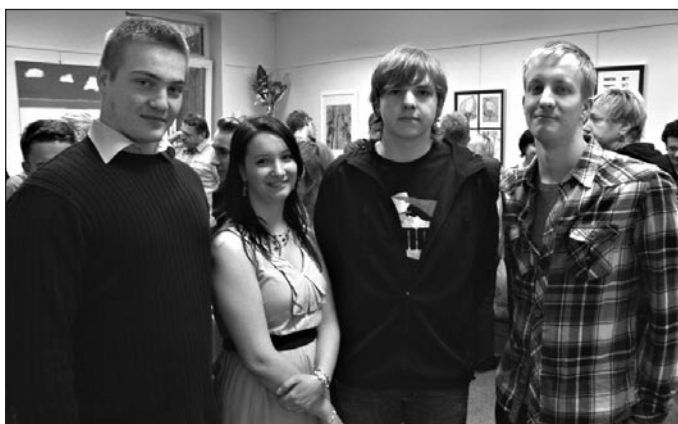
Autorka se svými kolegy z dob studií.

Text a foto: Karol Hercík, kurátor výstavy