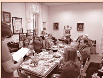
Přátelskou atmosféru předvánočního setkání v Domě u šraněk zaznamenal Karol Hercík

Poznámka red.: Změna programu vyhrazena.