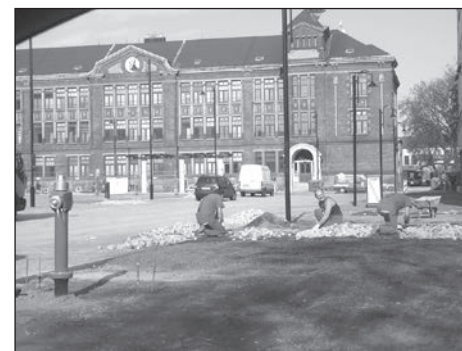
Rekonstrukce náměstí Jiřího z Poděbrad.