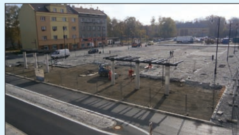
Náměstí Jiřího z Poděbrad v úterý 22. října dopoledne.