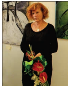
Autorka batikovaných obrazů