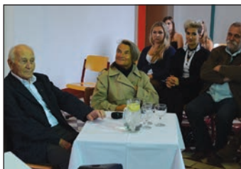
Beseda s pamětníky.