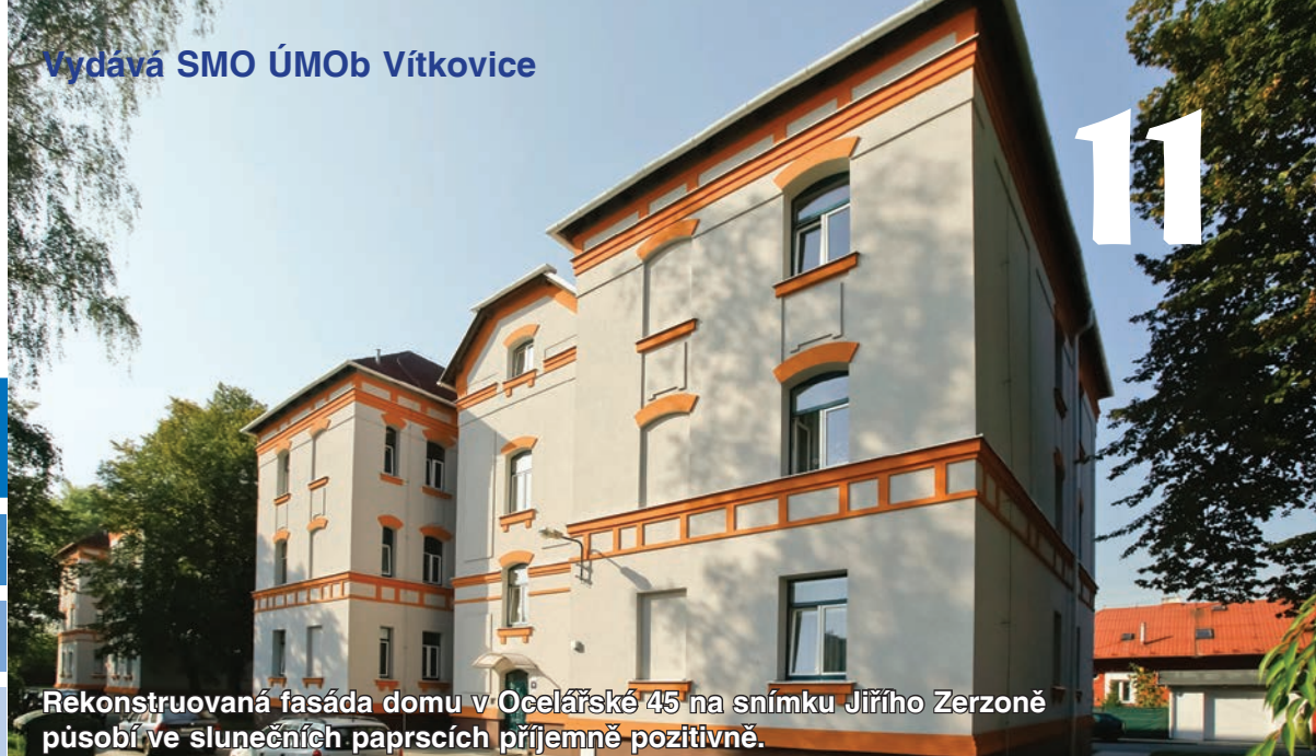
Rekonstruovaná fasáda domu v Ocelářské 45 působí ve slunečních paprscích příjemně pozitivně.

Nejlepší sportovci Vítkovic v roce 2012 str. 7