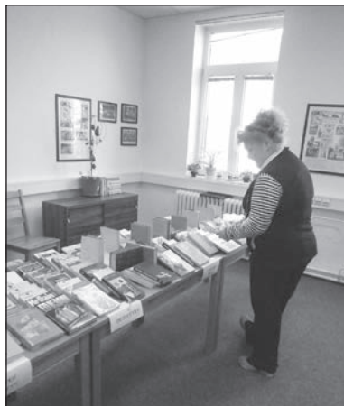
Květnový knižní bazar.