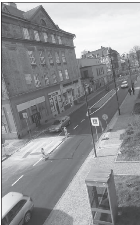
Rekonstruovaná ulice Halasova.