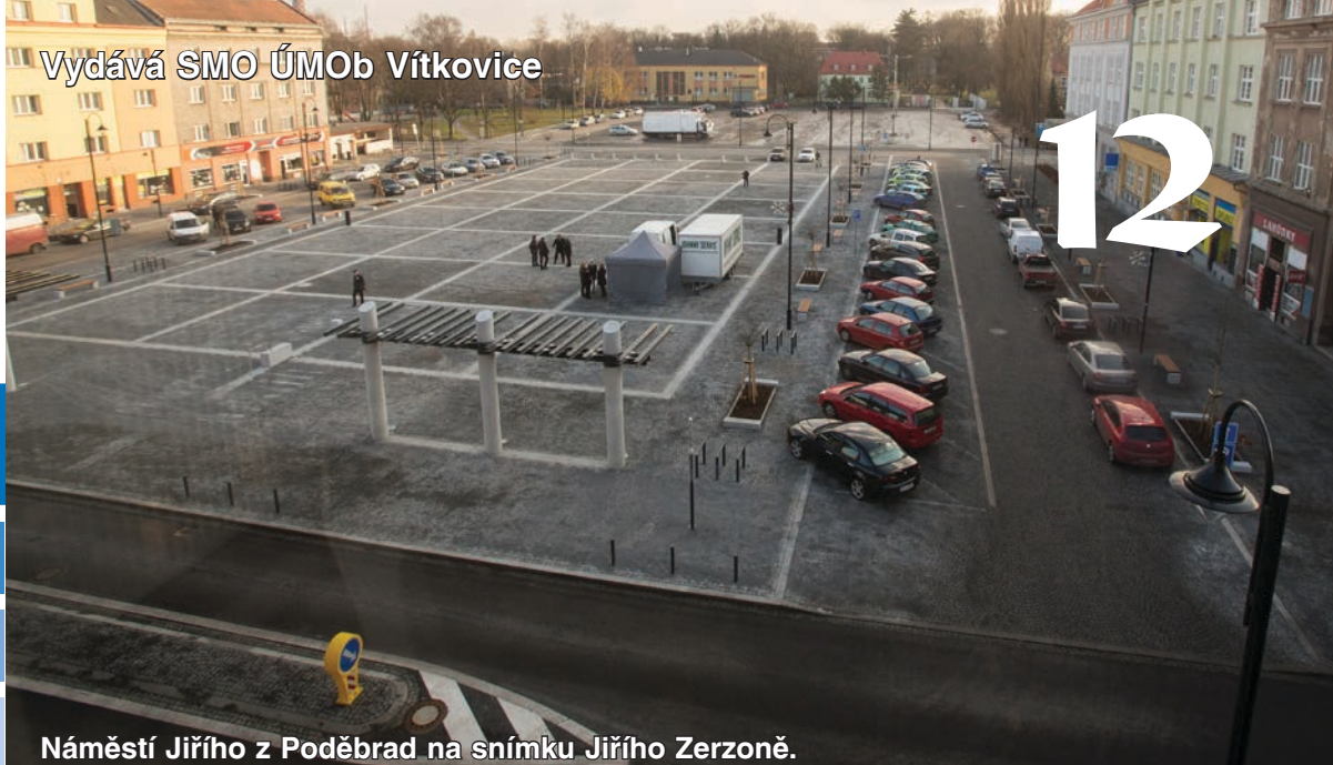
Náměstí Jiřího z Poděbrad na snímku Jiřího Zerzoně.