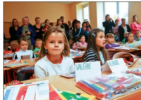
Napětí, ale i zájem, zvědavost a očekávání se zračí v očích žáčků, kteří právě prožívají svou velkou životní premiéru.