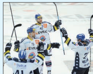
(zj)