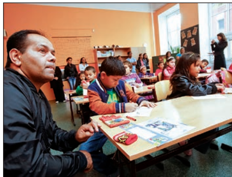
S doprovodem tatínka a maminky je vždy vše snadnější. I první den v opravdové škole.