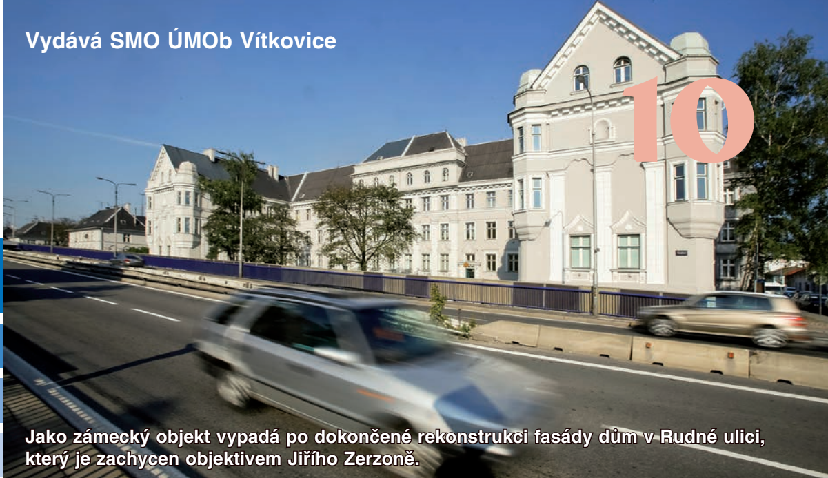
Jako zámecký objekt vypadá po dokončené rekonstrukci fasády dům v Rudné ulici, který je zachycen objektivem Jiřího Zerzoně.