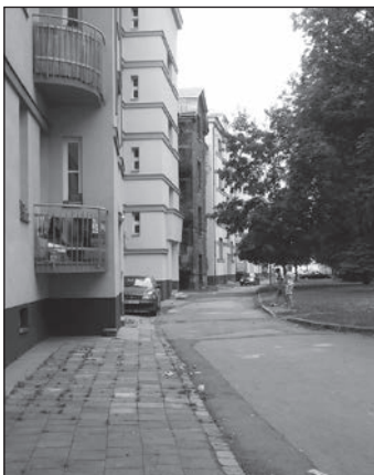
Vnitřní část objektu Štramberská 2 až 18 před rekonstrukcí.

U železničního přejezdu poblíž křižovatky ulic Štramberské a Ruské už v souvislosti s rekonstrukcí venkovních a vnitřních ploch objektu Štramberská 2 až 18 začalo kácení topolů. K rekonstrukci byl už předán také objekt Štramberská 29 a 29A i další dva domy v Sirotcích 41A a 43A. V rámci programu IPRM pokračují rozsáhlé změny na náměstí Jiřího z Poděbrad včetně přilehlých ulic a v ulici Zengrově. „Vedle toho budou z rozpočtu obvodu opravovány také chodníky podél ulic Pasteurova, Mečnickovova, Přerušovaná. V říjnu a listopadu bude takzvaný rekonstrukční boom ve Vítkovicích vrcholit, opravy budou probíhat na mnoha místech. Opět tedy prosíme naše občany i návštěvníky obvodu o shovívavost a trpělivost. Odměnou nám všem budou puvabnější Vítkovice s kvalitnějšími komunikacemi a chodníky,“ zdůrazňuje starosta Petr Dlabal.