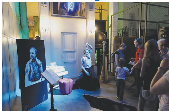
I v loňském roce mohli lidé v nočních hodinách poznat magické zákulisí divadla.

Ostravská muzejní noc, která bude slavnostně zahájena na Prokešově náměstí v sobotu 7. června v 17.30 hodin., bude trvat od 17 hodin do půlnoci. V Ostravě se představí více než třicet státních, neziskových a soukromých organizací. Jde o jedinou noc v roce, kdy se dveře muzeí, galerií a kulturních center otevírají v nezvyklém čase a nabízejí návštěvníkům nevšední zážitky.