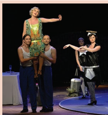
V Divadle Jiřího Myrona diváky okouzluje opereta Bratránek z Batavie.

Oznámení o tom, že soused bije ženu, dostala městská policie 11. října před půl desátou večerní. Po vstupu do domu našli strážníci v přízemí ležícího muže, kterého pěstmi napadl člověk, kvůli jehož agresivnímu chování strážci zákona dorazili. Protože za dveřmi bytu se stále ozývala hádka, strážníci se slovy „Městská policie, otevřete!“ zaklepli. V tu chvíli agresor napadl i je. A tak muž, který je podezřelý z trestného činu ublížení na zdraví, skončil v poutech, s nimiž si počkal na příjezd policistů.