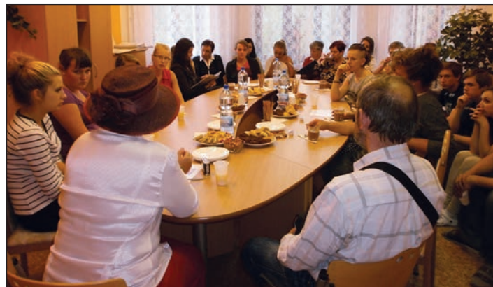
Posezení s ostravskými výtvarníky.