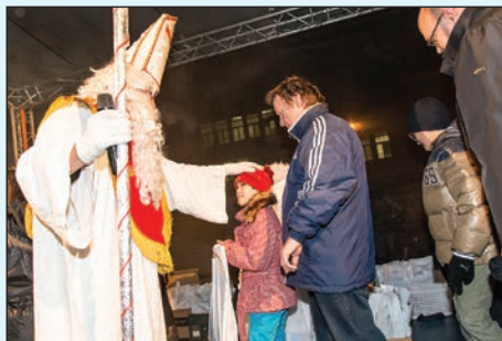
Těm nejhodnějším Mikuláš přidal i pohlázení.