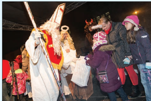
Na rozdávání dárků dohlíželi i čert a anděl.