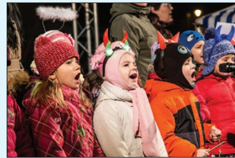
Nejvíce energie vložily do svého vystoupení děti z mateřských škol.