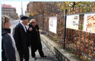
Ilustrační snímek z roku 2013.