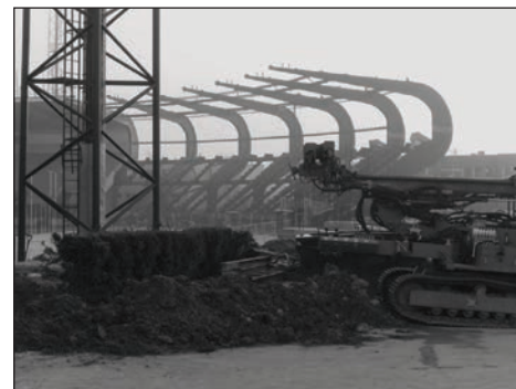
Snímky dokumentují probíhající rekonstrukci stadionu.

„Letos bude pro náš organizační výbor Zlaté tretry stěžejní atletické mistrovství Evropy v Praze, kde přijedou špičkoví sportovci z celé Evropy a bude zde prostor pro jednání o účasti na Zlaté tretře, která se uskuteční 26. května. Navíc věříme, že se našim sportovcům podaří na ME v Praze probojovat, že splní potřebné limity. Koncem června pak pořádně mistrovství ČR juniorů, junierek, dorostenců a dorostenek. Jde o takzvaný gigantický závod, kde startuje okolo 800 mladých atle-