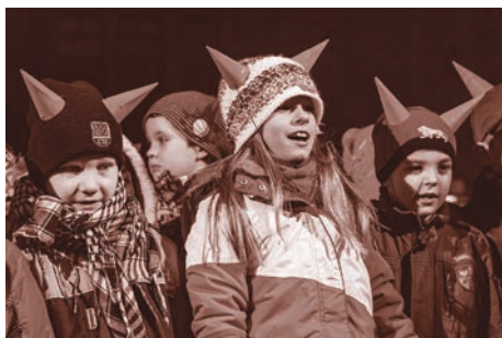
Děti ze Základní školy Halasova vystoupily i při rozsvícení vánočního stromu v prosinci loňského roku.

sluchátky, učebna výtvarných a pracovních činností, kde mohou děti modelovat z keramické hlíny, počítačová učebna a interaktivní učebna s multimediální tabulí, připravuje se otevření přírodovědné učebny. V té budou laboratorní stoly a koutek živé přírody s akvárii a terárii. „Školu neustále doplňujeme novým nábytkem a moderními učebními pomůckami. Zcela je již