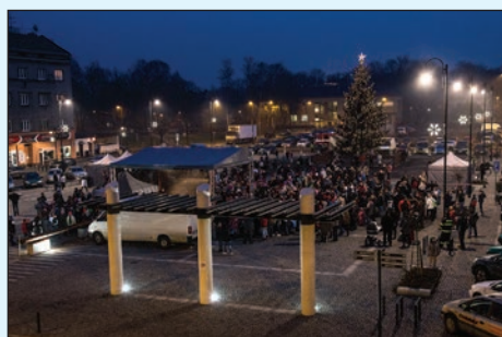
Vánoční atmosféra náměstí Jiřího z Poděbrad.