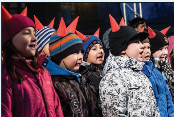
Na pódiu vystoupily děti ze základní a mateřských škol obvodu.