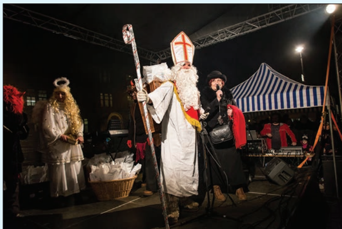
A přišel i Mikuláš...