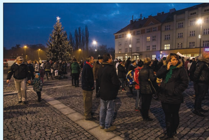
Začal advent a u vánočního stromu se potkávali známí a sousedé.