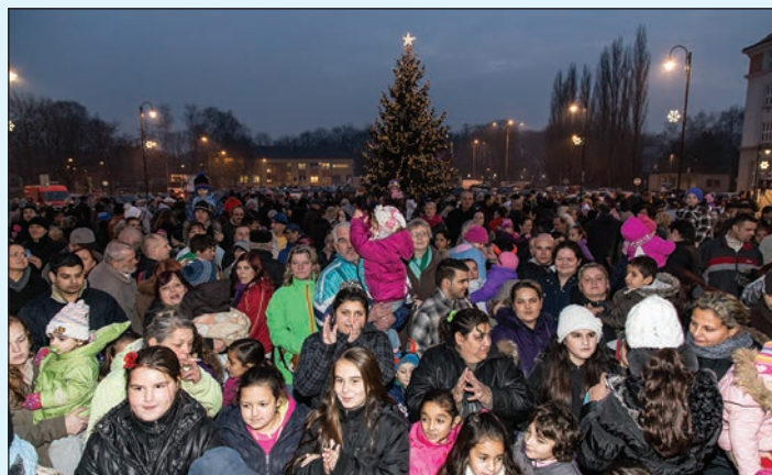
Na rozsvícení vánočního stromu se přišlo podívat zhruba 400 obyvatel Vítkovic.