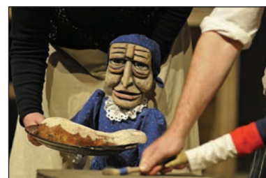
Pohádka O hubaté Doře.