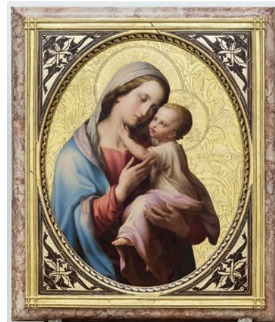
Leopold Kupelwieser, Madona s dítětem, 1851, olej, dřevo.