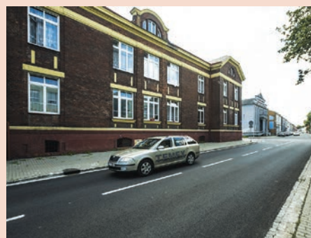
Zengrova ulice s novou asfaltovou pokrývkou očima fotografa Jiřího Zerzoně.