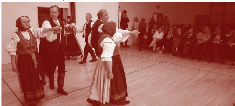
Vítkovští sokoli – ilustrační snímek z roku 2015.

Těšíme se na vaši návštěvu. Přijďte se buď podívat, nebo si i zacvičit a zatančovat s námi.