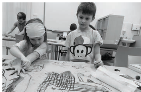
Děti se ve vítkovické knihovně nikdy nenudí.