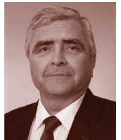
Petr Dlabal, starosta městského obvodu Vítkovice

Vážení čtenáři, přeji vám klidný a harmonický začátek léta plného slunce a příjemných zážitků. A žákům a studentům škol nejen na území našeho obvodu přeji úspěšné ukončení školního roku a šťastný vstup do báječných prázdnin, které se kvapem blíží!