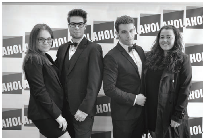
Autoři projektu Panda Education.

V dubnu se v Ahol – Střední odborné škole uskutečnilo hned několik akcí s cílem zviditelnit schopnosti a výsledky práce studentů školy. Prestižní záležitostí se stal už 10. ročník oborové soutěže Superstar v odborných znalostech, na níž účastníci prezentují své projekty z nejrůznějších oblastí. V letošním ročníku zaujal například v ekonomické kategorii projekt Videonewsletter jako moderní forma marketingu, humanitní kategorii ovládla prezentace Panda Education, zamýšlející se nad účinnou formou výuky cizích jazyků. Vrcholem soutěže už tradičně byla kategorie multimediální, kde na velkém plátně multikina CineStar studenti představili několik autorských filmů. Poděkování za podporu soutěže patří, kromě jiných subjektů, také Úřadu městského obvodu Ostrava-Vítkovice. Akcí, která zviditelnila dramatický a výtvarný talent aholských studentů, byla Absolutoria Pedagogického lycea – dramatický obor studentky zakončily představením Z deníku kocoura Modročka, které bylo spolu s dramatickým projektem určeno dětem z mateřské školy. V rámci výtvarné výchovy pak úspěšně obhájily své závěrečné práce, přičemž dokázaly, že se umí vyrovnat nejen s často neobvyklým zadáním, ale zvládnou i pestrou škálu výtvarných technik. Výsledky jejich práce je možné vidět do 12. května v Ahol Gallery, kde jsou rovněž prezentovány snímky z dubnové fotografické soutěže.