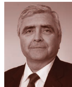
Petr Dlabal, starosta městského obvodu Vítkovice