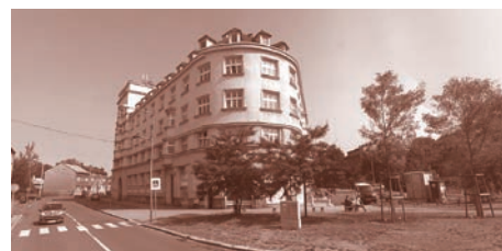
Blokové domy v ulici Štramberské.

Žádné odpojování v lokalitě Vítkovice totiž nehrozí. Firma ČEZ Energetické služby naopak počítá s dalšími investicemi, zvýšením efektivity výroby a dodávek tepla a s napojením dalších objektů, které jsou v investičním dosahu současné tepelné sítě. Společnost tak bude kontinuálně pokračovat ve výrobě a komfortních dodávkách tepla v městské části Vítkovice.