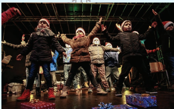
Do programu na pódiu se výrazně zapojily i děti z vítkovických mateřských a základních škol.