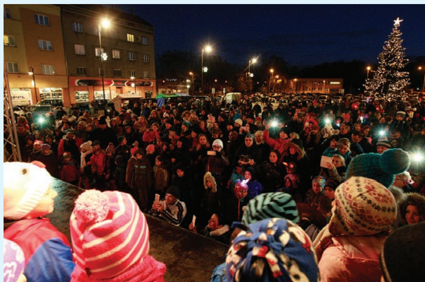
Rozsvícení vánočního stromu spojené s mikulášskou nadílkou přivedlo na náměstí mnoho obyvatel Vítkovic.