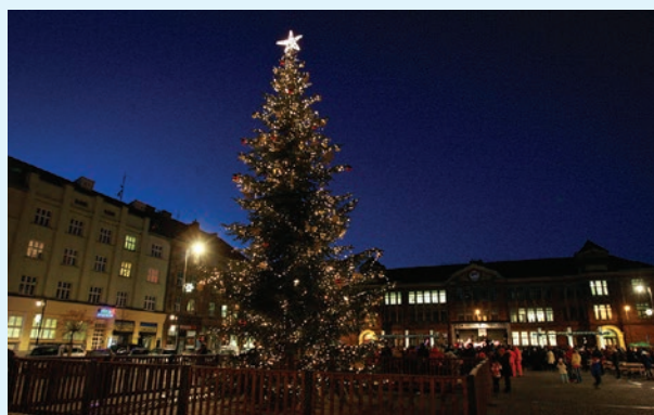
A tady je vánoční strom v celé svojí kráse.