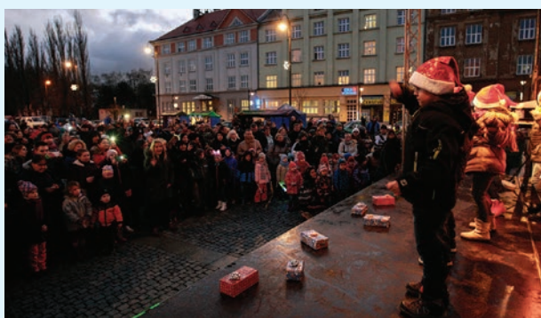
Vystoupení malých protagonistů sledovalo početné občanstvo.