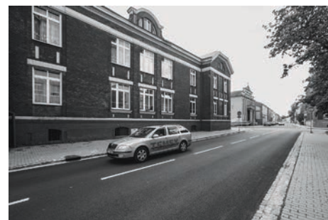
Novým povrchem se pyšní také ulice Zengrova.