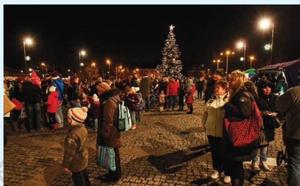
Obyvatelé Vítkovic spolu strávili příjemný adventní podvečer.