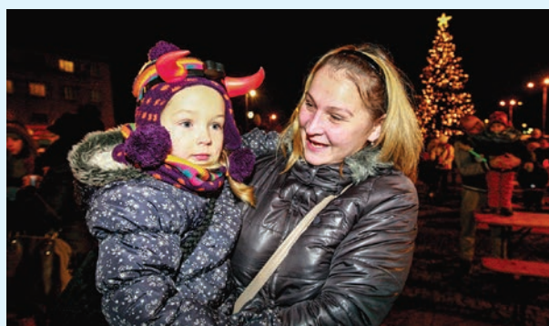
Děti si v doprovodu dospělých přišly pro nadílku.