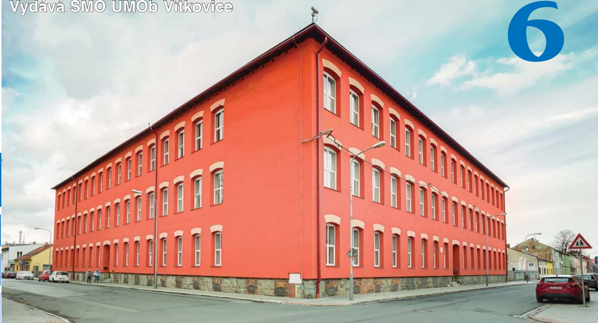
Budova RB SOU autoopravárenského v Zengrově ulici.

Senior express zatím zřízen nebude str. 8