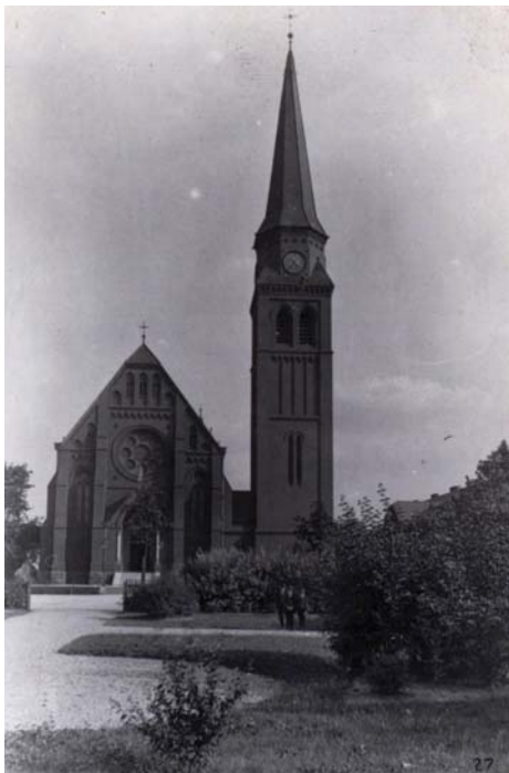
Kostel sv. Pavla.

Ve Vítkovicích se nachází mnoho významných a historicky hodnotných staveb, ale jen některé z nich o sobě dávají víc vědět. Patří k nim kostel sv. Pavla. Snad každý Ostravan procházel nebo projížděl vítkovickým Mírovým náměstím, na kterém se tato církevní památka nachází.