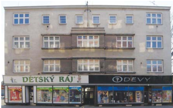
Dům v roce 2013.