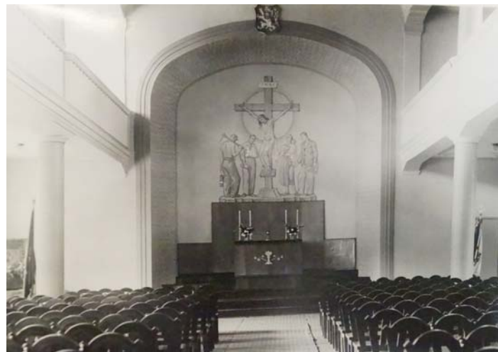
Stav interiéru vítkovického Husova sboru v období po roce 1948.

komoravskou. V tomto období přibývalo ve vítkovické náboženské obci členů z řad lidí, kteří byli nuceni opustit své domovské sbory v pohraničí. V tomto důsledku dosáhl v roce 1941 počet členů 5 tisíc osob. To znamenalo více darů i finančních prostředků. Dosáhlo se tak skoro úplného odstranění dluhů, které byly pozůstatkem z výstavby Husova sboru. Údobí po roce 1945 se neslo ve znamení rekonstrukcí či nutných oprav. Za zmínku stojí koupě nových varhan od krnovské firmy Rieger-Kloss v roce 1957. Původní varhany z roku 1924 byly zničeny vodou zatékající z nekvalitně postavené střechy.