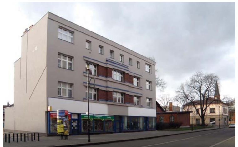
Foteno 20. prosince 2014 po ukončení rekonstrukce.

i dalšími provedenými úpravami vizuálně posunul o kus vpřed. Takže jsme spokojeni,“ hodnotí provedenou rekonstrukci. Karol Hercík upozorňuje, že během rekonstrukce byla z bezpečnostních důvodů i kvůli úspoře tepla uzavřena pasáž, jež tu původně byla. „Obchody, které tu dřívě měly výlo-