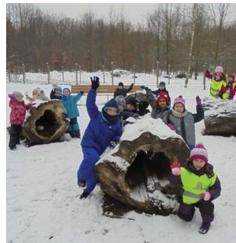
Děti z MŠ Kořenského si zimu opravdu užili.

nás, zaměstnanců, a které souvisejí především s naší chutí dělat něco jinak a nově. Od září letošního roku totiž chceme začít s dětmi pracovat jinak, více se zaměřit na individuální možnosti každého dítěte. S tím souvisí i změna pohledu na každé dítě, na jeho diagnostiku a tak dále.