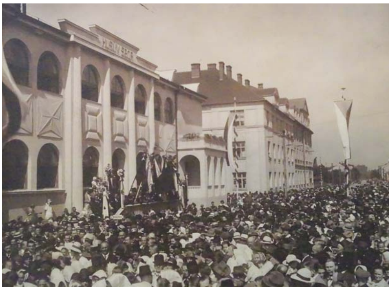
Slavnostní otevření Husova sboru ve Vítkovicích 17. srpna 1924.

Na letošní sté výročí vzniku samostatného Československa navazuje ještě jedna velice významná, pro Českou republiku zásadní událost, a to ustanovení zcela nové, specificky národní církve Čechoslováků – Církve československé (od roku 1971 bylo do názvu přidáno adjektivum husitská). Stalo se tak v lednu 1920 v Praze a šlo o vyvrcholení společenských poměrů po rozpadu Rakouska-Uherska. Byly tím naplněny požadavky po reformě náboženského života, na které římskokatolická církev doposud nebrala zřetel. Mezi novinky československé církve patřilo kupříkladu sloužení liturgie v národním jazyce či nepovinný celibát.