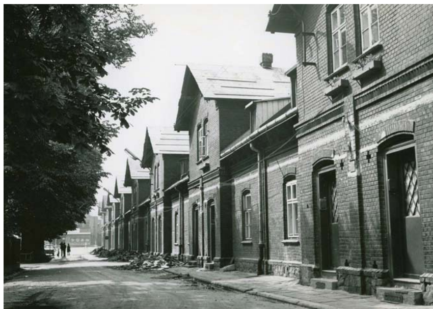
Štítová kolonie v roce 1975.

Tento výčet kolonií však není zcela úplný a v jejich seznamu bychom mohli pokračovat i dále, za všechny jmenujme ještě třeba domy úřednické kolonie ve Štramberské či Ruské ulici. Zaměstnanci dolu Louis našli svůj domov v Barbořině kolonii. Mimo katastr Vítkovic, avšak vystavěné pro zaměstnance Vítkovických železáren, sloužily Hulvácká dělnická kolonie (postavena v roce 1899, postupně rozšiřována mezi léty 1910 až 1911 a roku 1921) nebo Jubilejní dělnická kolonie v Hrabůvce (výstavba probíhala v letech 1921, 1926 až 1931, 1939 až 1940 a 1946 až 1948). Název „jubilejní“ dostala kolonie u příležitosti 100. výročí založení Vítkovických železáren v roce 1928.