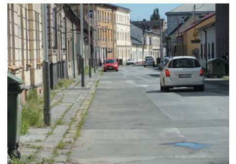
Chodník v ulici Erbenově.