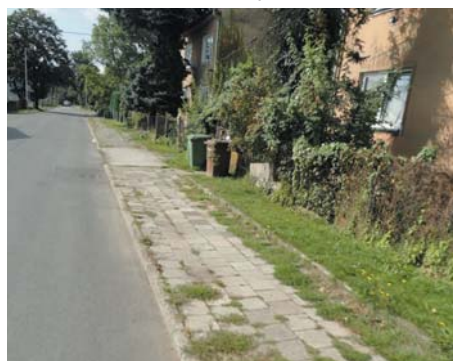
Chodník v ulici Středulinského.

Realizací obou staveb dojde ke zkvalitnění pěší dopravy v našem obvodě, kdy nový povrch zaručí pohodlnější užívání a snazší