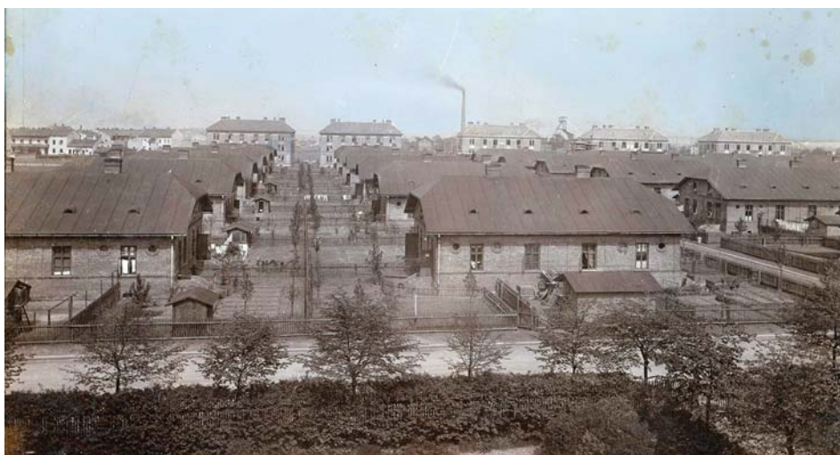
Dělnické domy v Josefínské kolonii v roce 1913.

Bytová otázka byla v rámci sociální politiky železáren jednou z nezákladnějších. Právě železářny se velice intenzivně podílely v období 1878 až 1918 na budování domů pro své zaměstnance. Tehdejší generální ředitel Vítkovického horního a hutního těžářstva zpracoval nový sociální program, jenž se věnoval právě bytové péči o zaměstnance železáren. Počet bytů bylo třeba s dalšími léty mnohonásobně navýšit, a proto se původně malá vesnička Vítkovice přeměňovala na tovární ves nejen rozrůstajícími hutěmi, ale i občanskou výstavbou. V roce 1880 čítaly Vítkovice 2 591 obyvatel, roku 1890 to bylo 10 294 a sčítání lidu z roku 1910 už přineslo údaj de facto dvojnásobný: 23 151.