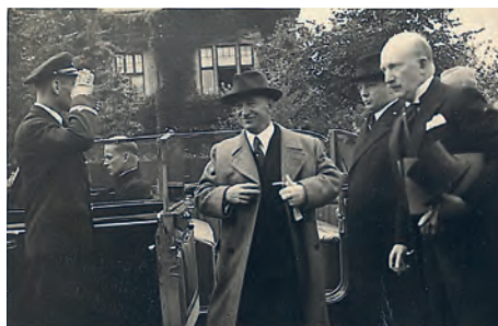
Návštěva prezidenta Beneše v roce 1938. Na snímku s generálním ředitelem Vítkovických železáren Oskarem Federerem. Salutuje Václav Caiz, osobní pilot generálního ředitele.

Křest publikace se za účasti autorů a vedení radnice uskuteční ve středu 12. prosince od 16 hodin v Knihovně města Ostravy, pobožce Vítkovice, ulice Kutuzo-