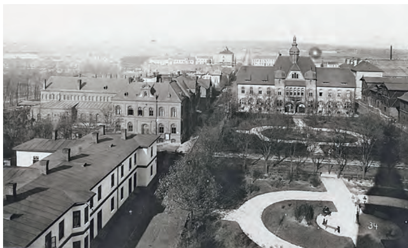
Pohled na vítkovickou radnici v roce 1905.

Pokud se poohlédneme po vzniku názvu Vítkovice, je odvozeno čelední příponou -ovice od osobního jména Vítek a znamená „ves lidí Vítkových“. Tento Vítek byl pravděpodobně zakladatel osady, ale mohl to být i význačný člověk, s nímž se v určité době osada spojovala – kupříkladu majitel či lokátor. Jsme zde svědkem jevu, kdy se původní jméno obyvatelské (Vítkovici) stává