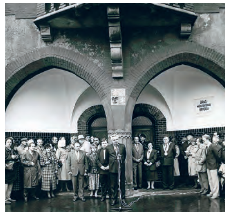
Krátký projev generálního ředitele Vítkovic Františka Hromka před slavnostním předáním budovy radnice obvodu byl zaznamenán 6. dubna 1992.

vova 14. Publikace byla finančně podpořena z rozpočtu statutárního města Ostravy na základě poskytnutého účelového neinvestičního transferu.