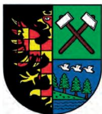
Znak městského obvodu Vítkovice

Když se řekne symbol, mnoho z nás si vybaví symbol státní. Ukolem tohoto příspěvku je však přiblížit a popsat symboly městského obvodu Vítkovice, které k němu náležejí. Věnovat se budeme původní vítkovické pečeti, obecnímu znaku, praporu i objasnění názvu obce i historii zdejší radnice, reprezentující světský úřad v centrální části tzv. Nových Vítkovic.