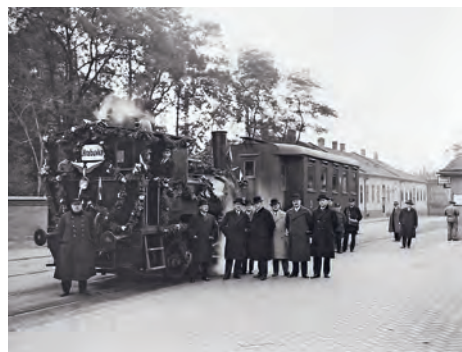
Zahájení provozu na parní dráze Vítkovice – Hrabůvka 5. října 1930.

Publikace je volným pokračováním knihy, která byla vydána v roce 2002 u příležitosti stého výročí radnice městského obvodu Vítkovice. Nová publikace bude mít stejný formát a bude obsahovat převážně dobové fotografie s přechodem do současnosti. Mnohé fotografie, které městský obvod získal z podnikového archivu spo-