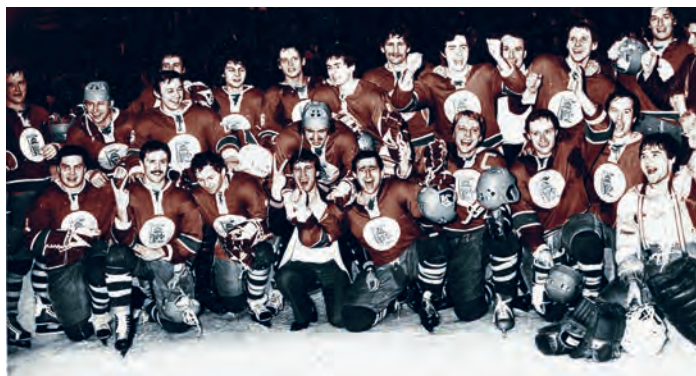
Rok 1981, mistrovský titul