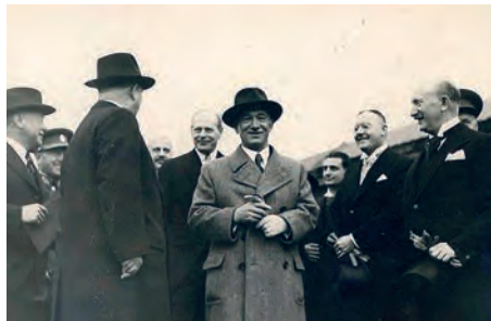
Rok 1937 – návštěva Edvarda Beneše ve Vítkovicích.