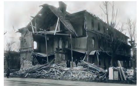
Rok 1944 – I Haus v Ruské ulici po bombardování.