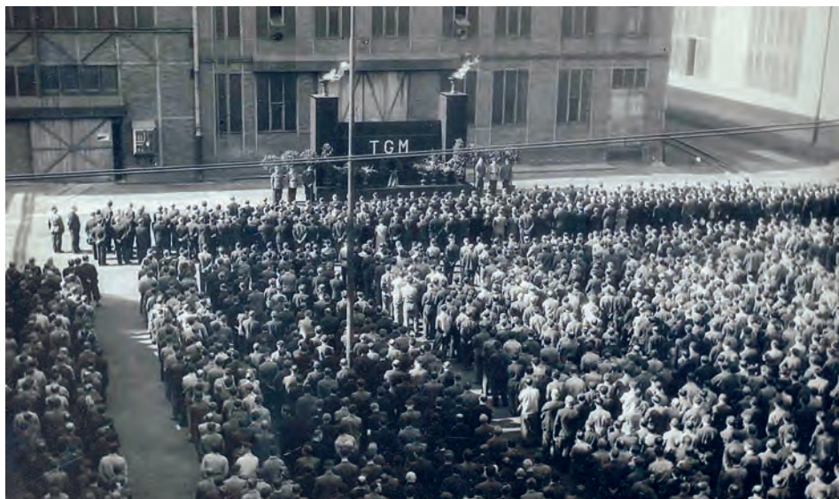
Smuteční slavnosti ve Vítkovicích po smrti T. G. Masaryka v roce 1937.