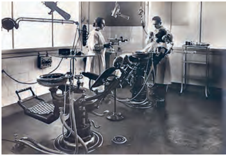
Rok 1924, zubní ambulance.

V období první republiky vzrostl počet lůžek v nemocnici na 486 a zdravotnické zařízení také získalo výborné renomé díky vysoké odborné úrovni léčebné i ošetrovatelské péče. Na mezinárodní výstavě ve Štrasburku v roce 1923 pak také nemocnice obdržela za tuto kvalitu péče zlatou medaili.