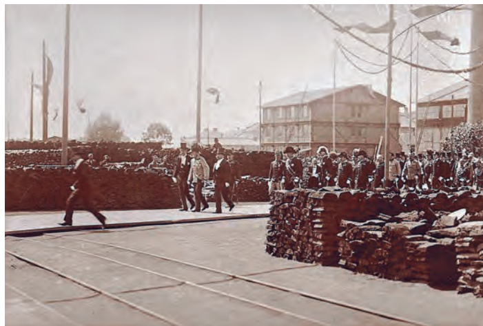
Císař František Josef I. při návštěvě Vítkovických železáren dne 28. června 1906.

Představitelům města Vítkovice byl však roku 1913 představen projekt vytvoření tzv. Velké Ostravy, ke které se měly v budoucnu připojit též Vítkovice. S tím Vítkovičtí samozřejmě nesouhlasili, a proto byl tento plán na několik let umlčen. Nakonec tomu ale nezabránilo a v roce 1924 se staly Vítkovice součástí nově vzniklého města Moravská Ostrava. Jeho částmi se staly dříve samostatné moravské obce Hrabůvka, Mariánské Hory, Moravská Ostrava, Nová Ves, Přívoz, Vítkovice a Zábřeh nad Odrou.