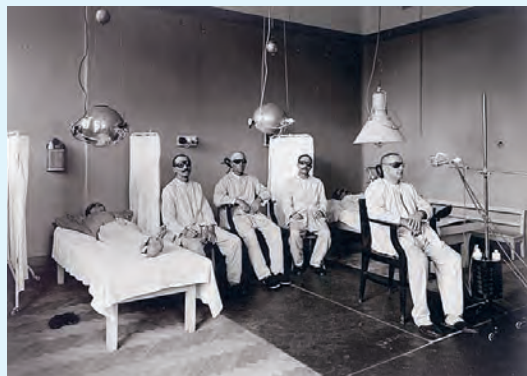
Rok 1926, léčba horským sluncem.