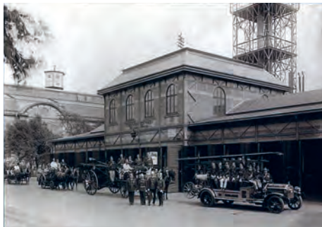
Rok 1911 – hasičská jednotka před zbrojnicí.