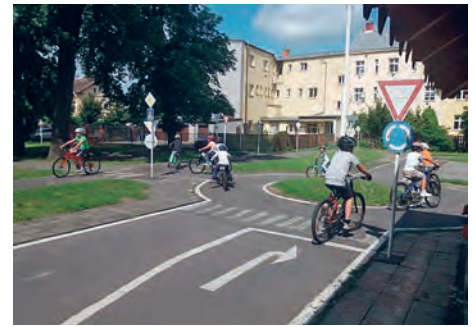
Výuka dětí na dopravním hřišti.