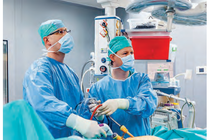
Součástí nemocnice je dnes 12 lůžkových oddělení a 25 ambulancí.