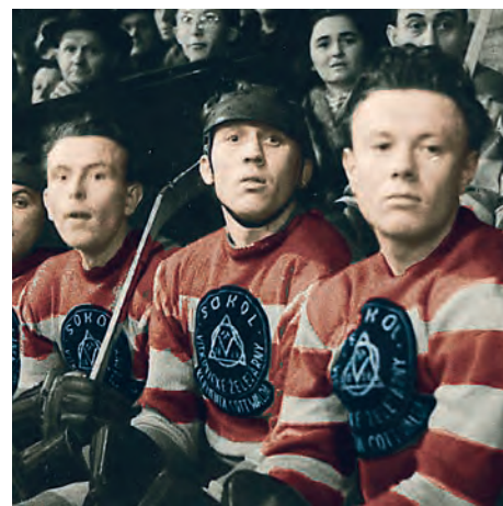
Rok 1952, střídačka

Vítkovický hokej není jen výčtem medailí a úspěchů, ale také zástupem výbor-