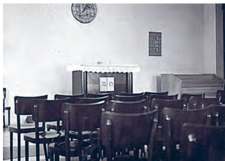
Interiér evangelické modlitebny ve Vítkovicích.

Na tomto hřbitově byl v roce 1862 vysvěcen menší evangelický kostel a poté se Ostrava stala filiálním sborem Orlové. Samostatný sbor v Ostravě vznikl roku 1875. Na přelomu 19. a 20. století dosavadní kos-