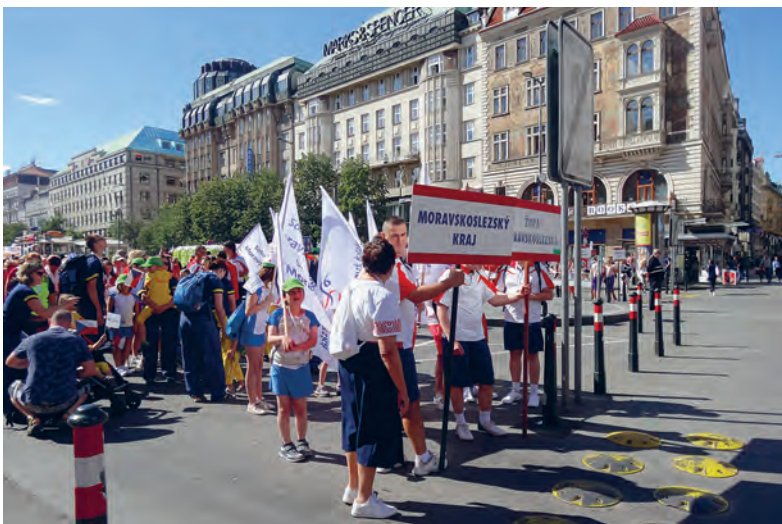
V průvodu na Václavském náměstí

Naši cvičenci odjžděli už 30. června vlakem do Prahy, aby se ubytovali v tělocvičně Sokola Vršovice a byli připraveni druhý den už v 10 hodin na Václavském náměstí spolu s dalšími 15 tisíci sokoly jít v průvodu Prahou. Zážitek to byl obrovský a stejné byly i následující dny. Kromě společných