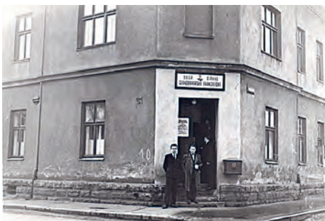
Evangelická modlitebna na nároží ulic Ocelářské a Obránců míru.

Během mapování vítkovické historie jsme se věnovali zdejšímu působení několika náboženských společenství: římskokatolické církvi, židovské náboženské obci a Církvi československé husitské. Tentokrát si přiblížíme existenci jednoho z dalších – Českobratrské církvi evangelické, která měla v letech 1952 až 1999 ve Vítkovicích vlastní sbor. Tato církev letos slaví 100 let existence a je proto na místě pohlédnout hlouběji k jejím kořenům. Ty můžeme hledat už v roce 1781, ve kterém tehdejší císař Josef II. vydal toleranční patent. Na základě tohoto výnosu o náboženské svobodě byla vedle římskokatolické církve „trpěna“ i další vyznání, a to augsburské (luteránské), helvétské (kalvínské) a řeckopravoslavné. Evangelíci tak mohli například vykonávat veřejné funkce, provozovat živnosti nebo vlastnit majetek. Myšlenkově měli blízko k husitství i odkazu bratrské církve.