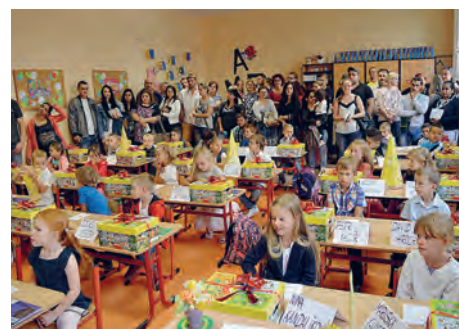
Základní škola Vítkovice působící v Halasově ulici.