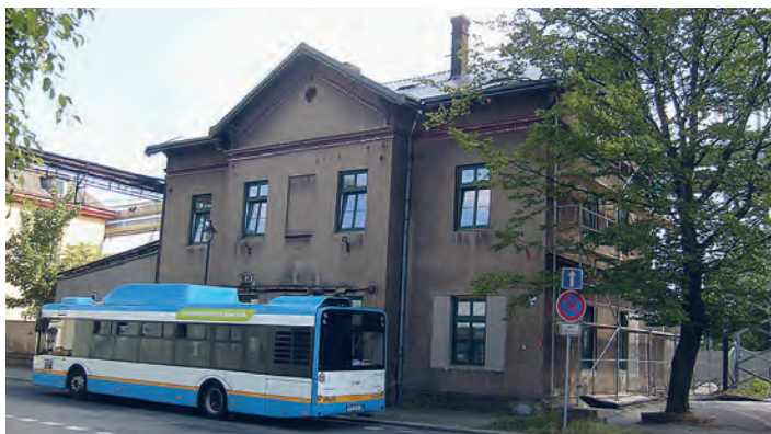
Objekt bývalého Kostelního nádraží nedaleko Mírového náměstí.

Spletitá síť železničních kolejí prochází prakticky celým katastrem Vítkovic. Přitom mnohé úseky trati už zanikly. A ty, které existují dodnes, dokládají průmyslovou historii i současnost této ostravské čtvrti.