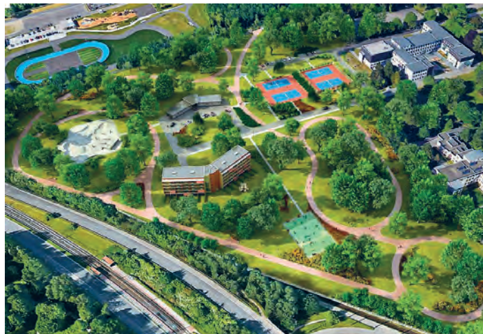
SAC celkový pohled