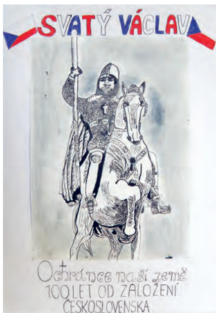
1. místo Pavla Úberlauerová.