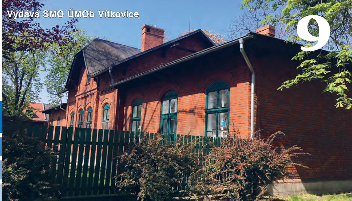
Budova, v níž sídlí Mateřská škola Prokopa Velikého.