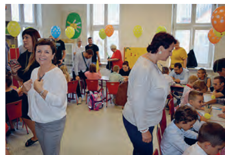
Soukromá základní škola PRIMA v Pasteurově ulici.