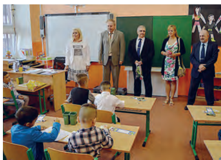
Základní škola Vítkovice působící v Šalounově ulici.