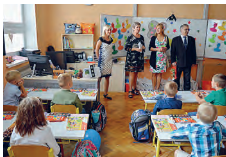
Základní škola PORG Ostrava.