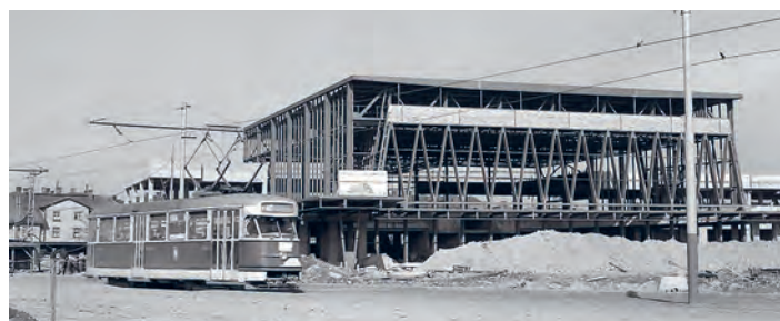
Výstavba vítkovického nádraží – 60. léta 20. století.

Autorem projektu nádraží byl český architekt Josef Danda (1906–1999) ze Státního ústavu dopravního projektování v Praze. Ten se už v roce 1966 zmiňoval o tom, že v Ostravě není předpoklad pro vznik centrálního hlavního nádraží, ale že se zde uplatní systém několika nádraží, která budou plnit své funkce. Na mysl