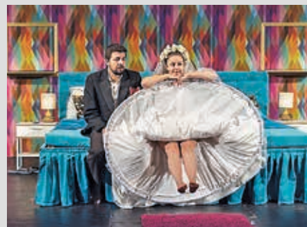
Ráno po tom

Pokud není označeno jinak, začátky představení v 19 hodin.